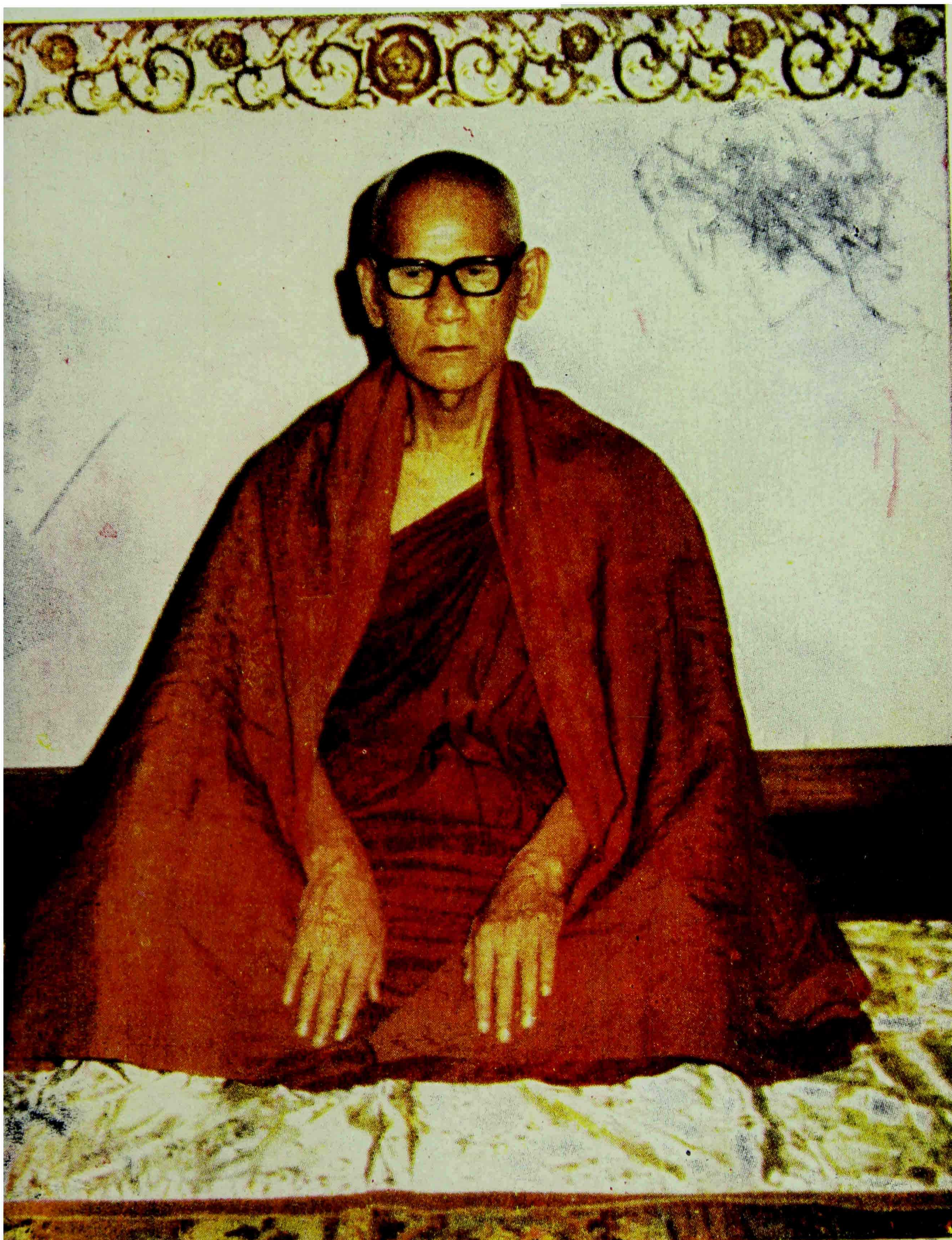
ဆဋ္ဌသင်္ဂီတိ ပုစ္ဆက အဂ္ဂမဟာပဏ္ဍိတ ကျေးဇူးတော်ရှင် မဟာစည်ဆရာတော်ဘုရားကြီး