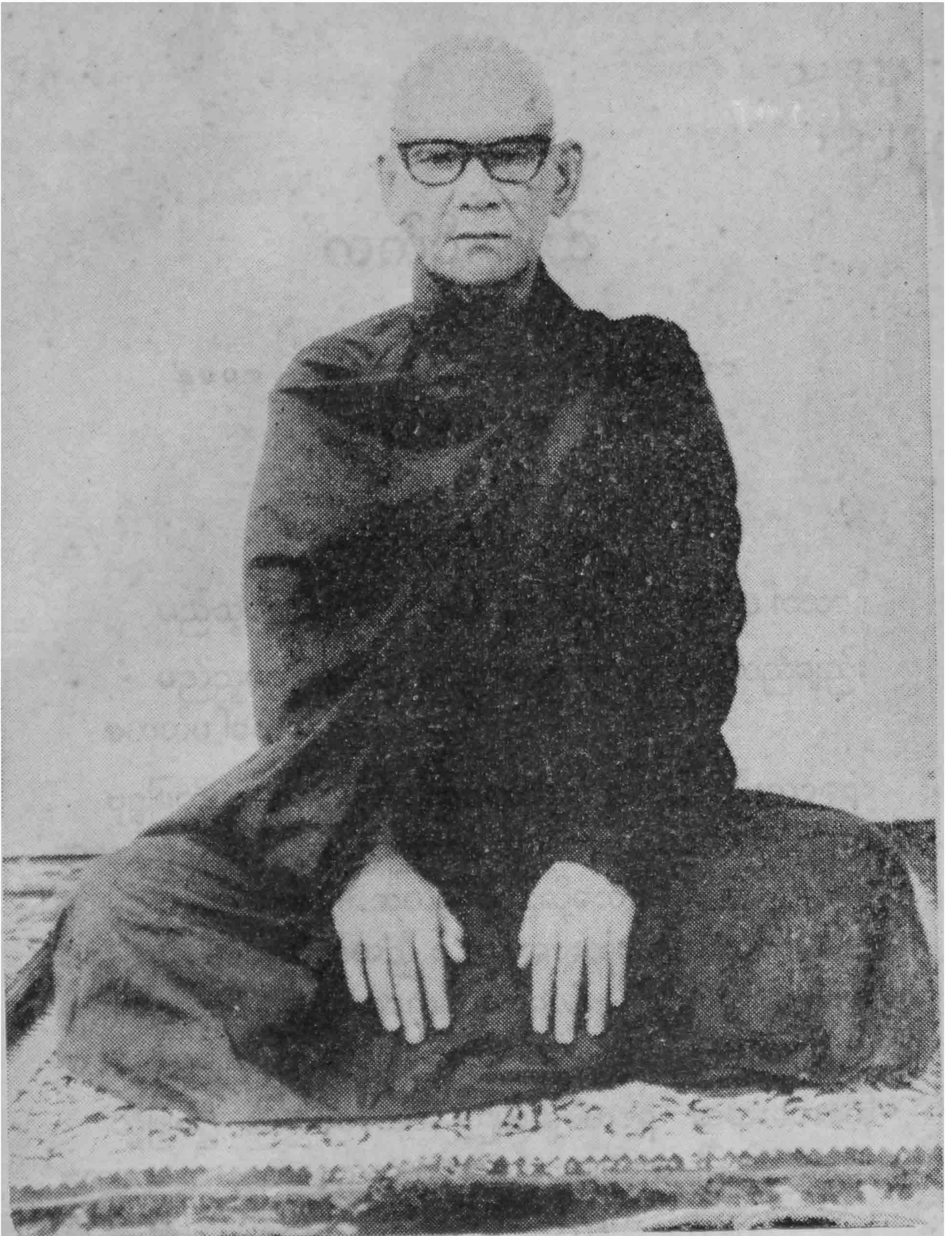
ဆဋ္ဌသင်္ဂီတိပုစ္ဆက အဂ္ဂမဟာပဏ္ဍိတ ကျေးဇူးတော်ရှင် မဟာစည်ဆရာတော်ဘုရားကြီး ၁၃၃၈-ခု၊ ဝါခေါင်လတွင် ရိုက်ကူးသည်။