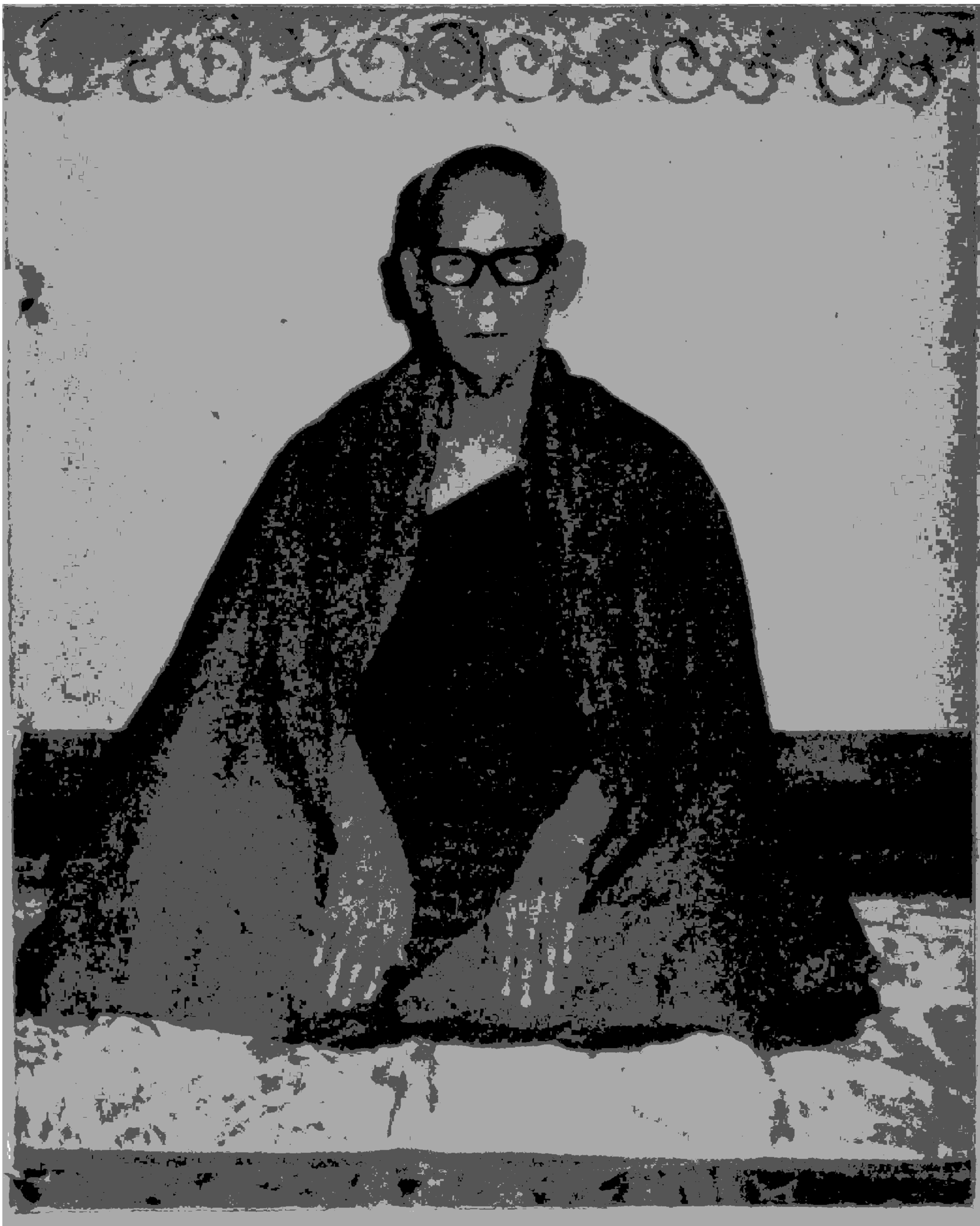
ဆဋ္ဌသင်္ဂီတိပုစ္ဆက အဂ္ဂမဟာပဏ္ဍိတ ကျေးဇူးတော်ရှင် မဟာစည်ဆရာတော်ဘုရားကြီး