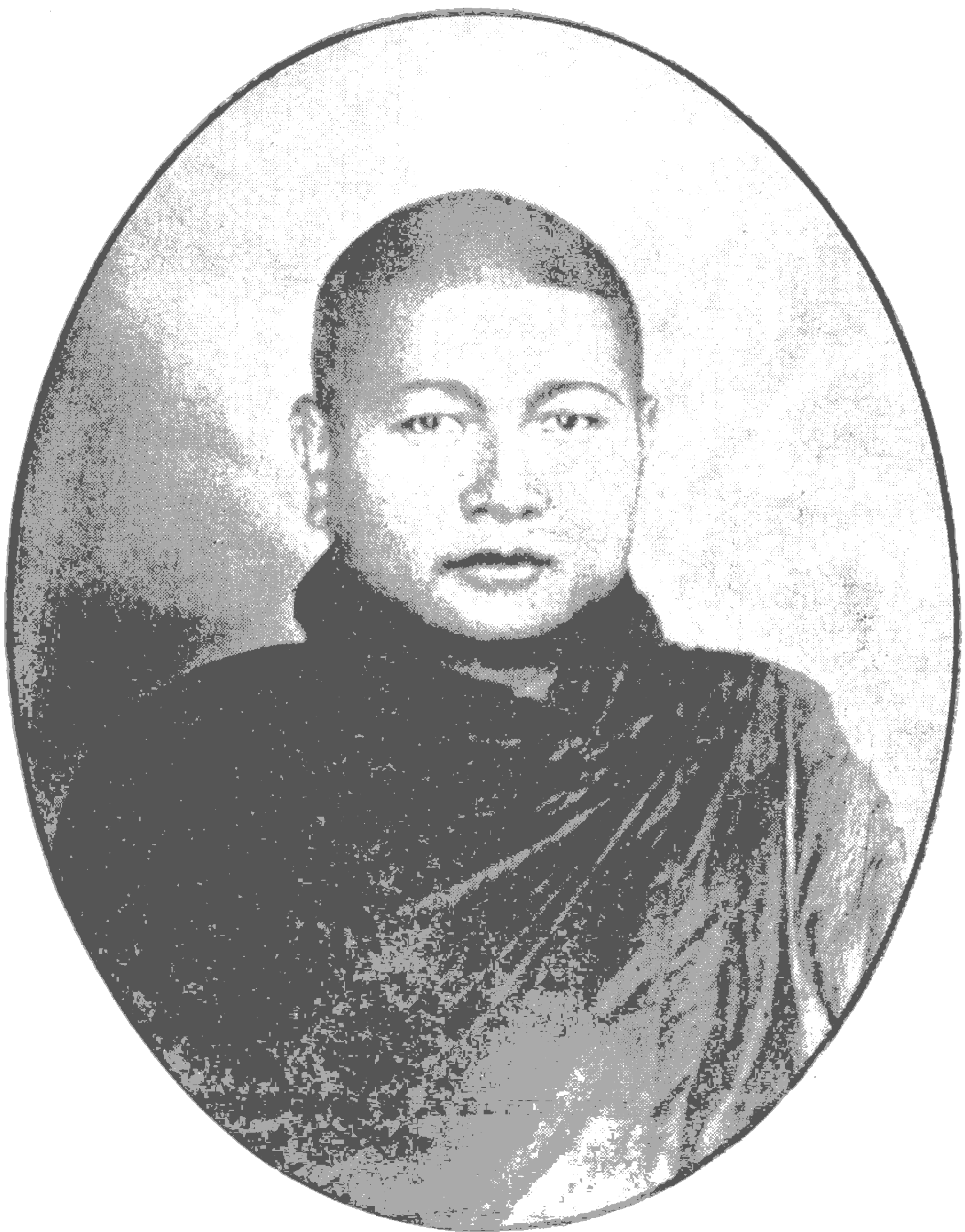
ညောင်လေးပင်မြို့ တောရကျောင်း ဆရာတော်ဘုရားကြီး