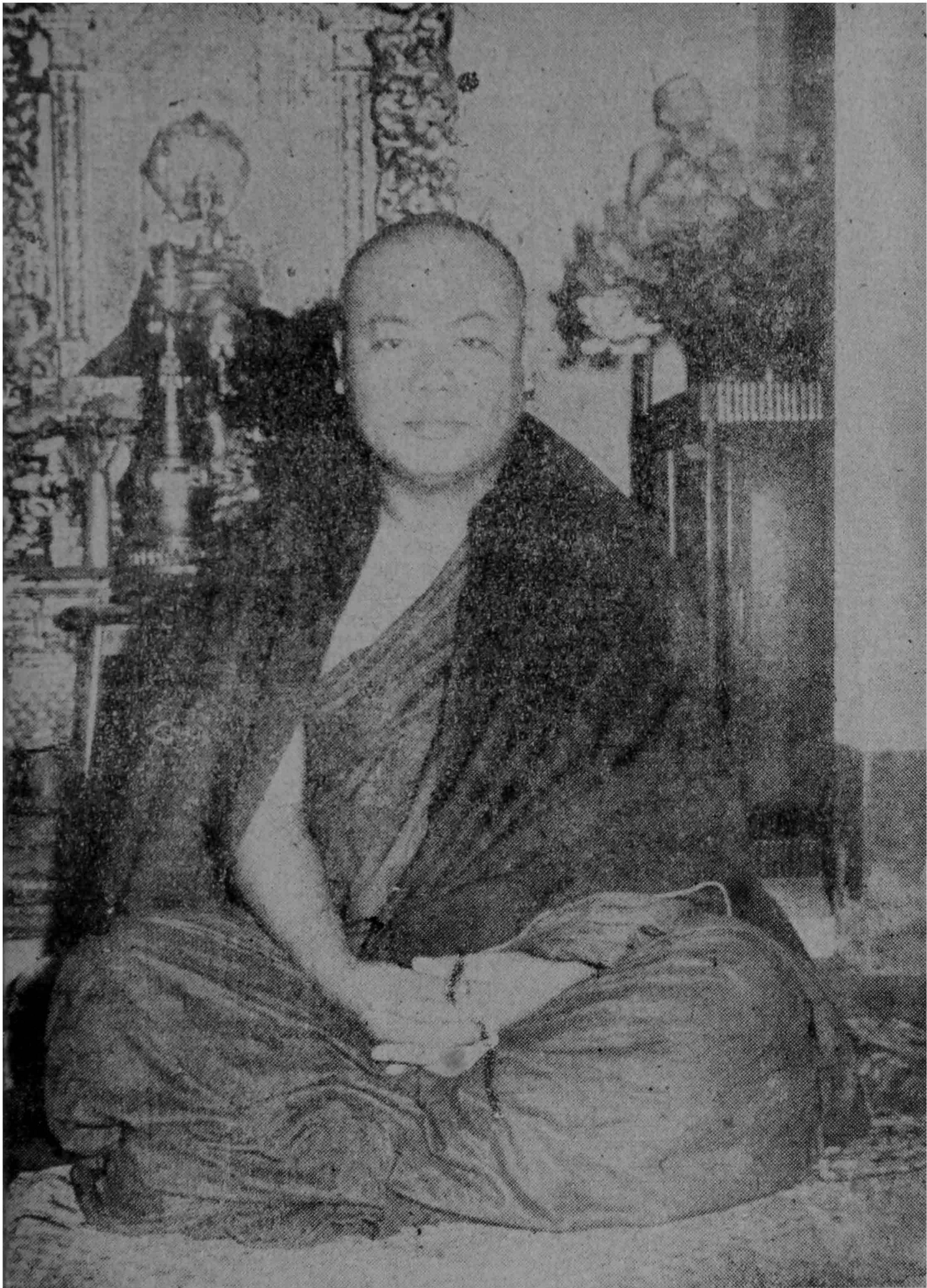
ကျေးဇူးရှင် ယောက်ကော်ကျွန်းမြတ်ဆရာတော်ဘုရားကြီး.