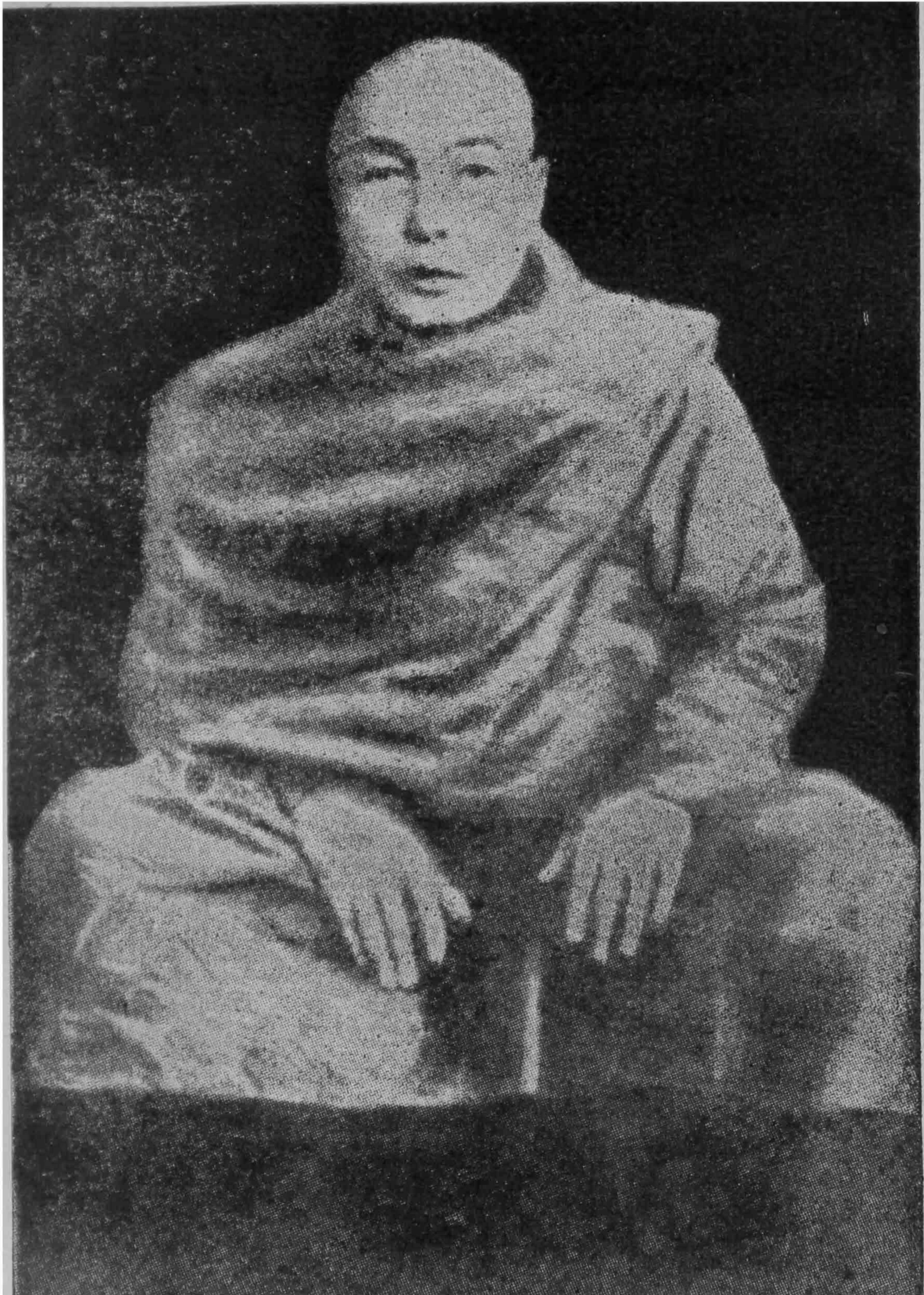
စစ်ကိုင်းတောင်ရိုး ရွှေဟင်္သာတိုက်သစ် အဘိဓဇမဟာရဋ္ဌဂုရု ရွှေဟင်္သာဆရာတော်