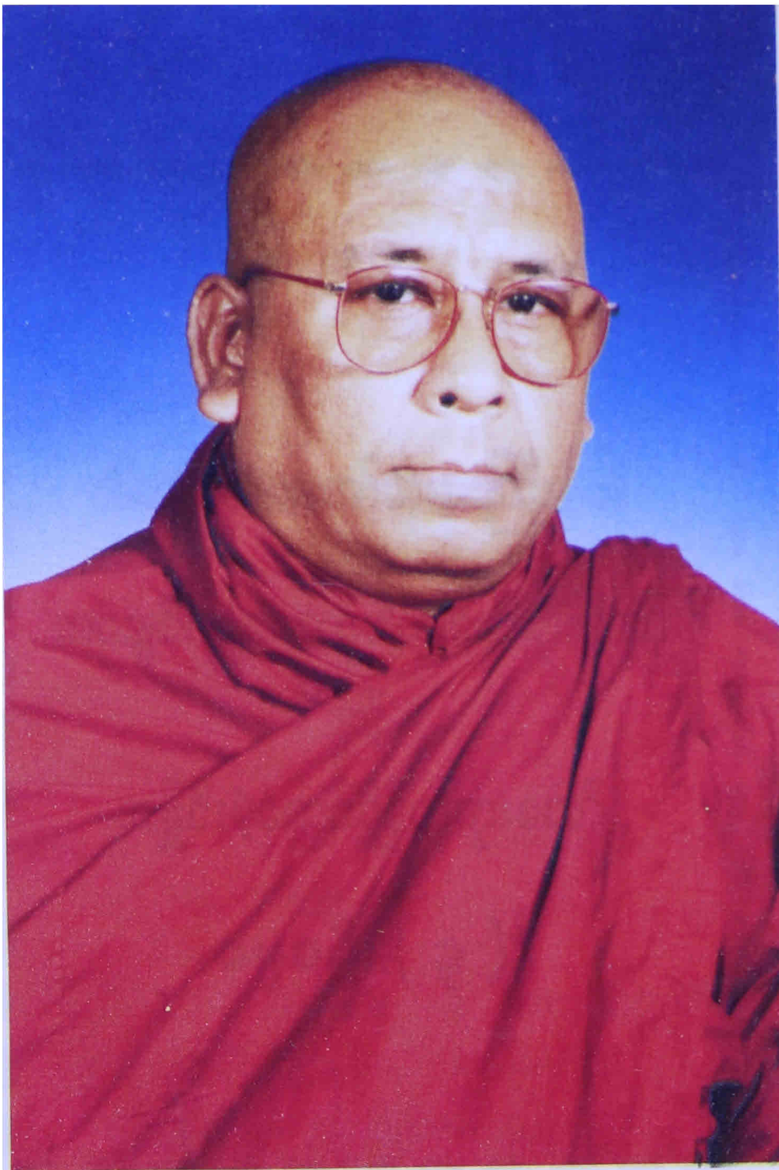
သီတဂူဆရာတော် အသျှင်ဉာဏိဿရ