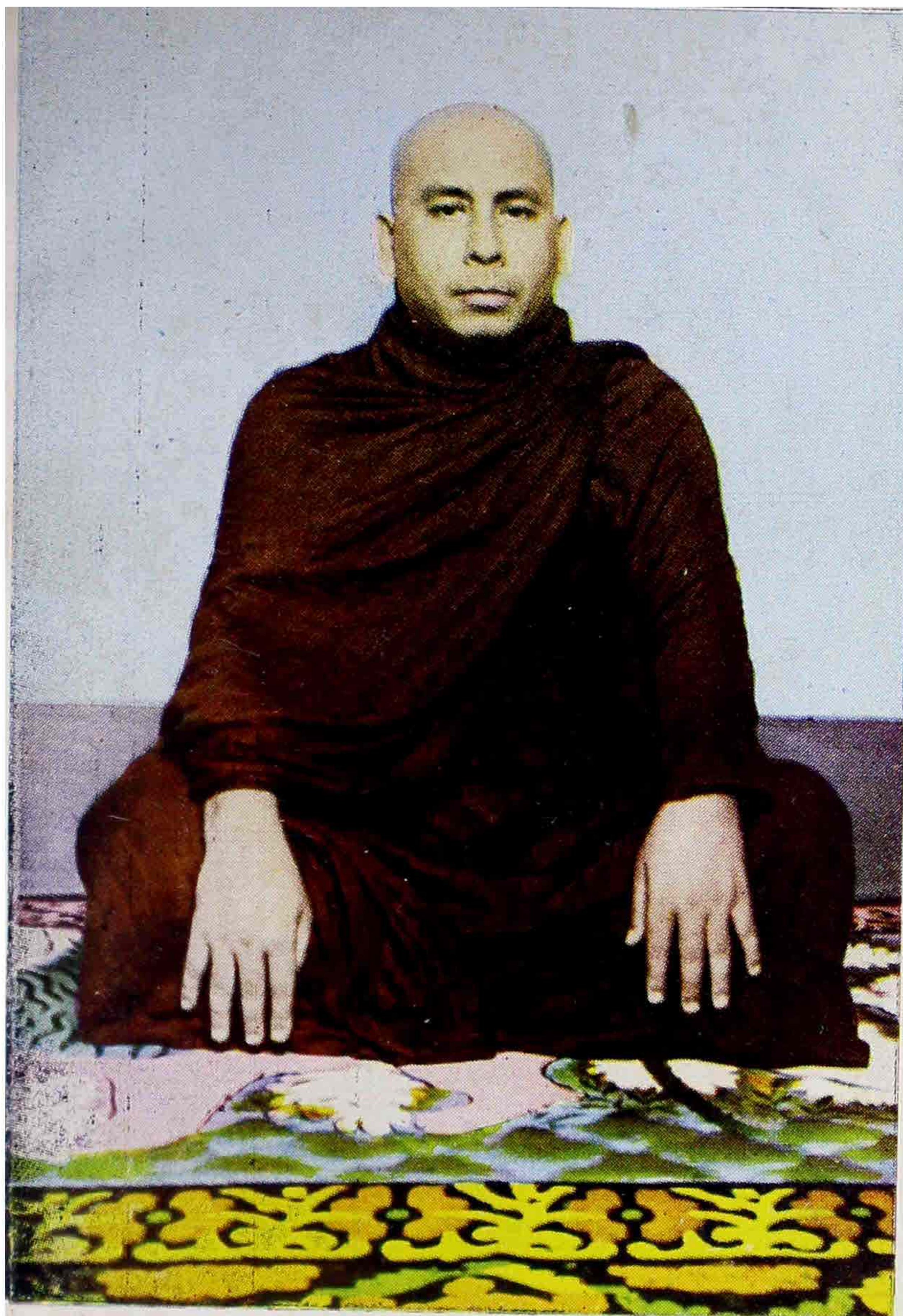
သဲကုန်းဆရာတော် အရှင်ဉာဏိဿရ