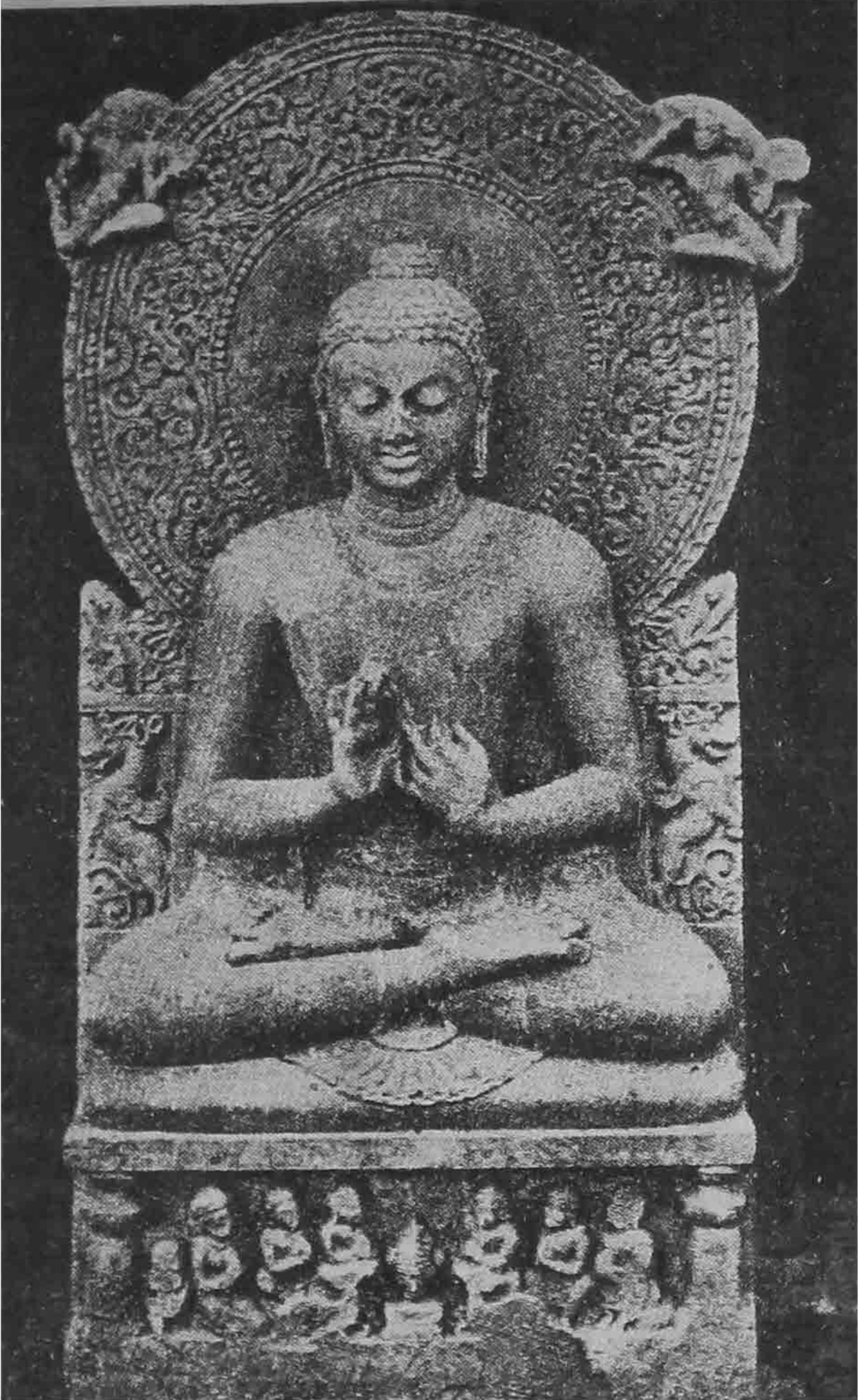
ဗုဒ္ဓမြတ်စွာဘုရား ဓမ္မစကြာတရား ဟောကြားနေပုံ