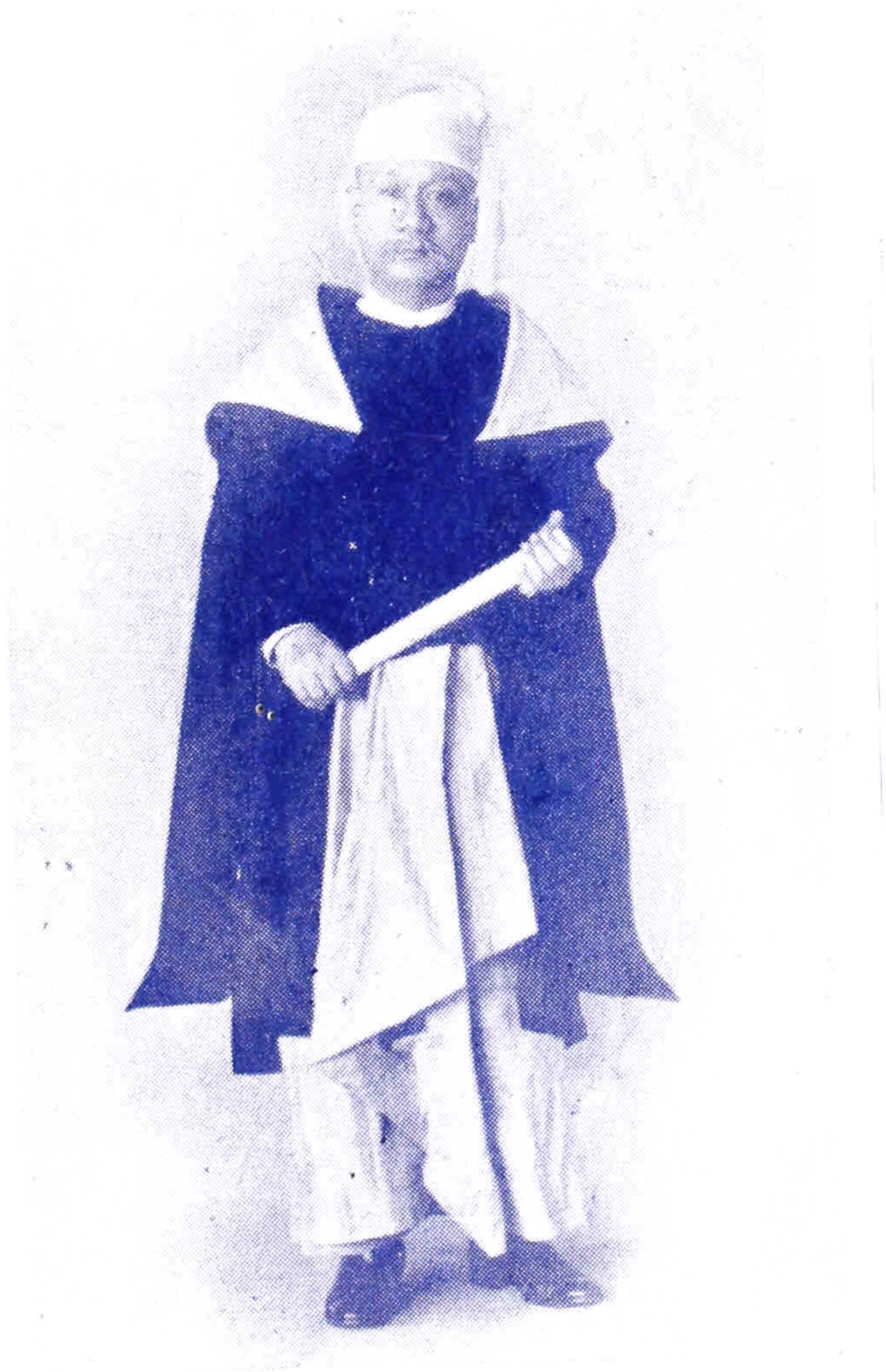
အမ်မအေ - မဟာဝိဇ္ဇာ လယ်တီပ ညှိတ် - ဆရာဦးမောင်ကြီးပုံ။