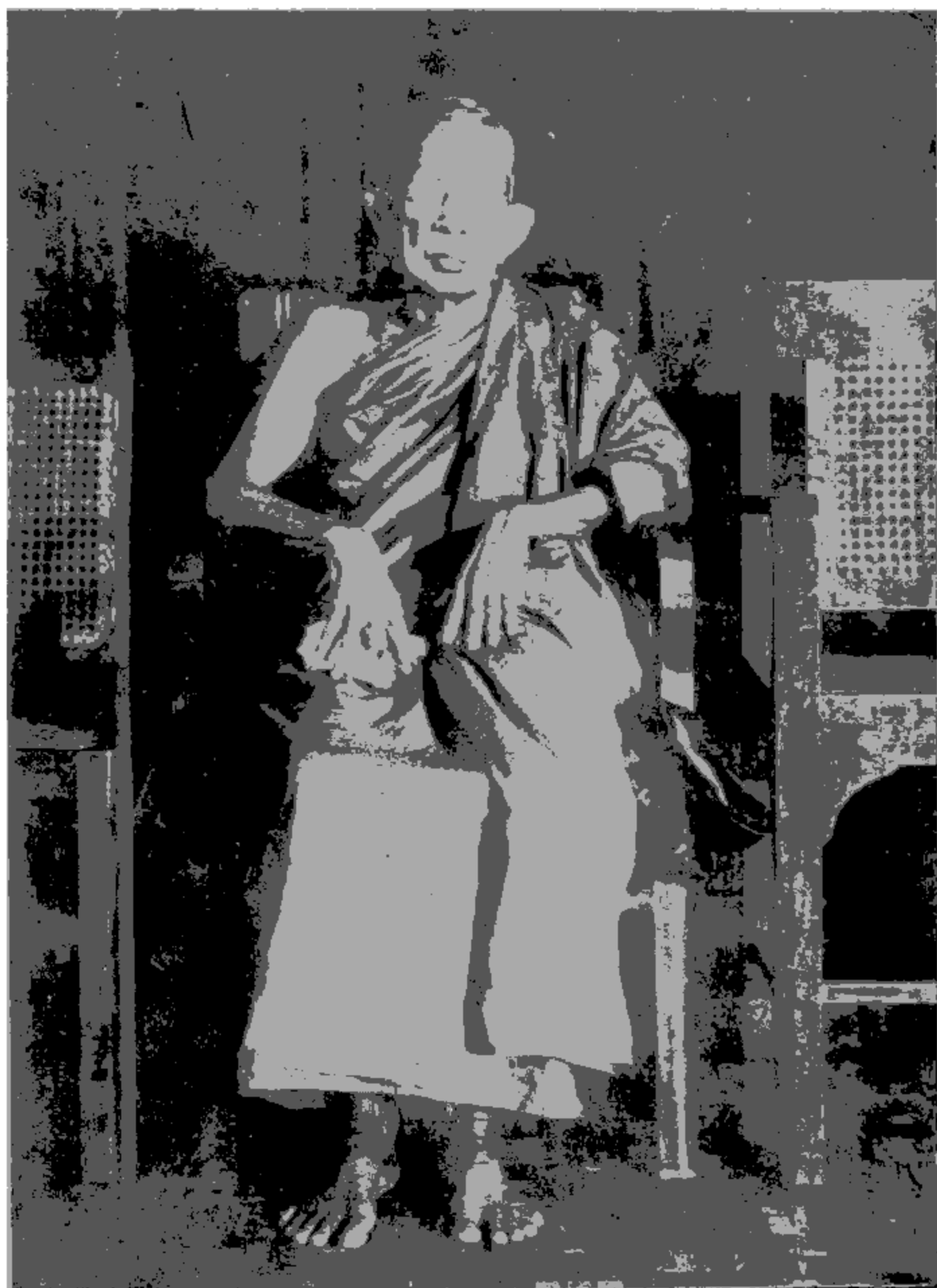
ရွှေကျင်သာသနာပိုင် အဘိဓမ္မဟာရဋ္ဌဂုရု သက်တော်ရာကျော်ရှည် စံကင်းဆရာတော်ဘုရားကြီး