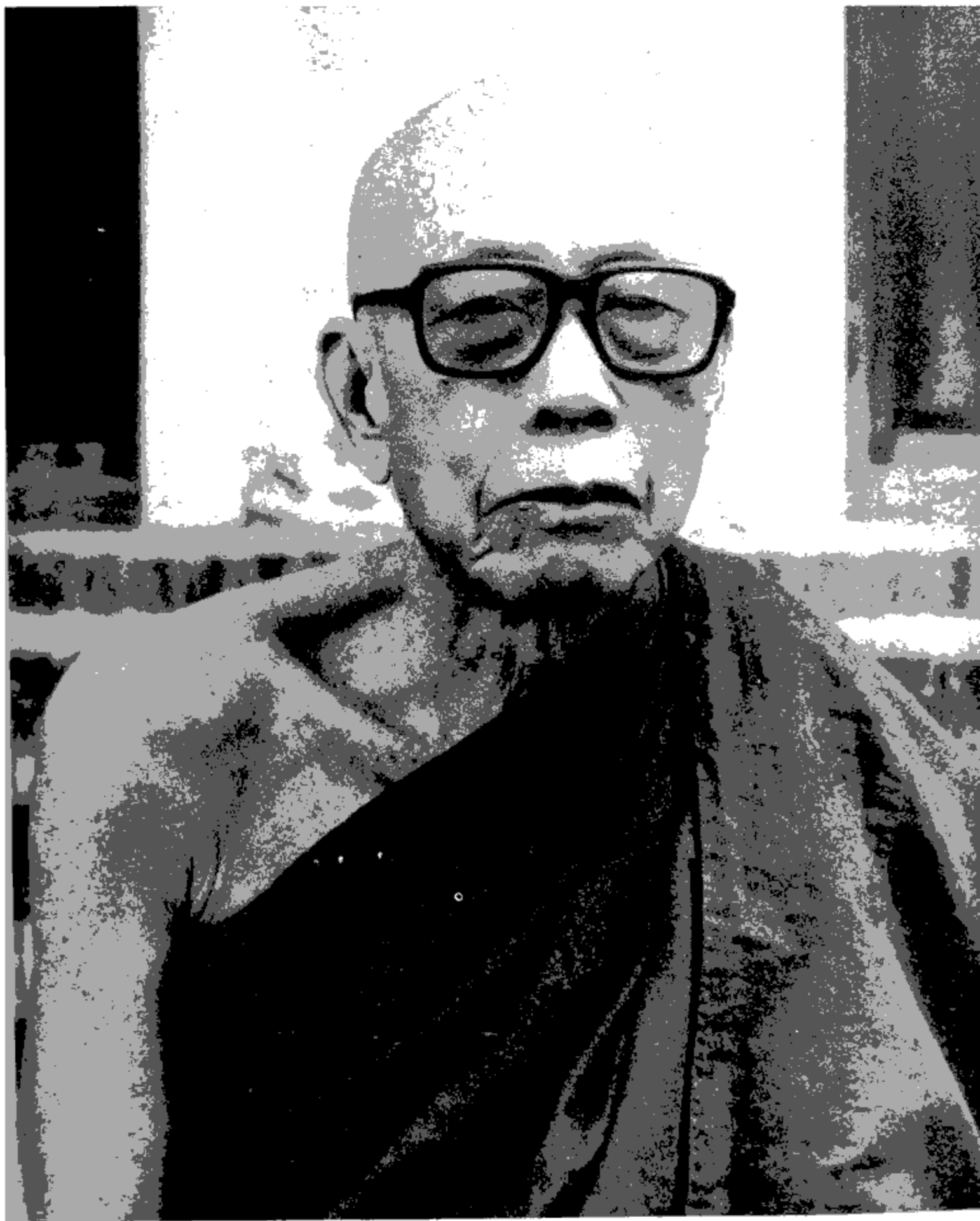
ရွှေကျင်နိကာယ ဥပဥက္ကဋ္ဌ မဟာနာယက တွဲဖက် ရွှေကျင်သာသနာပိုင် မဟာဝိသုဒ္ဓါရုံတိုက်သစ် ပိုက်ကျုံးဆရာတော်