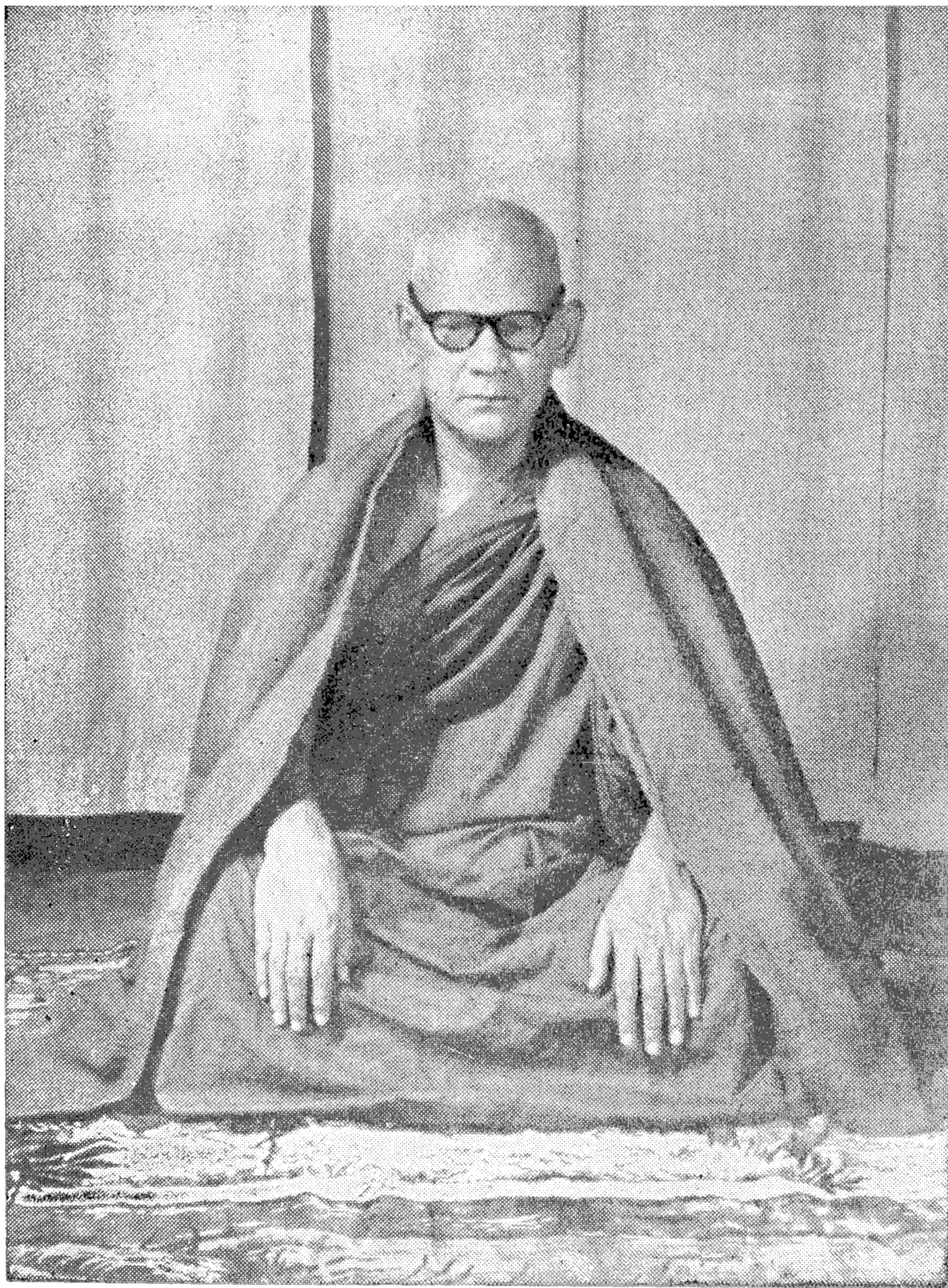
အဂ္ဂမဟာပဏ္ဍိတ မဟာစည်ဆရာတော်