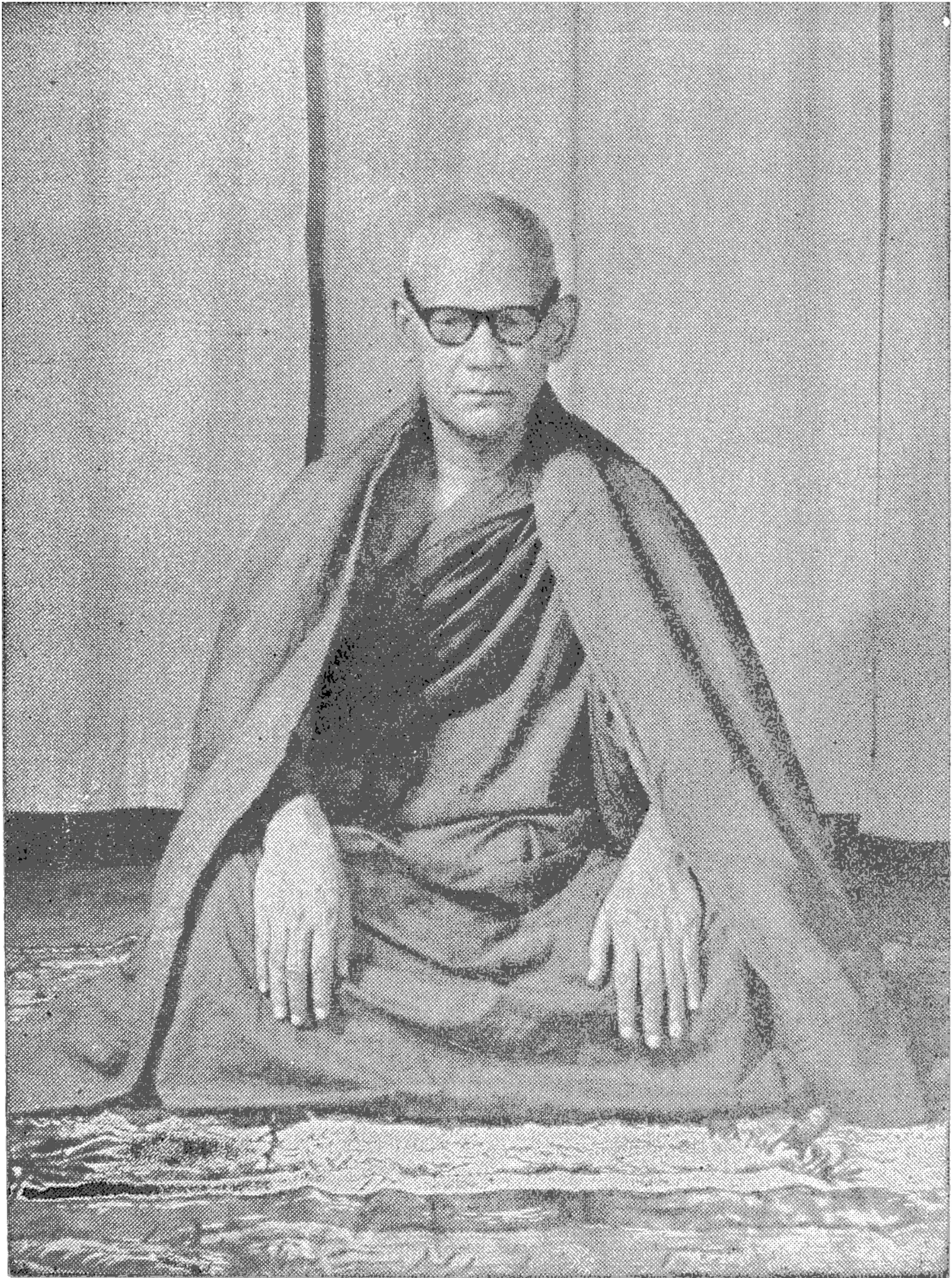
အဂ္ဂမဟာပဏ္ဍိတ မဟာစည် ဆရာတော်