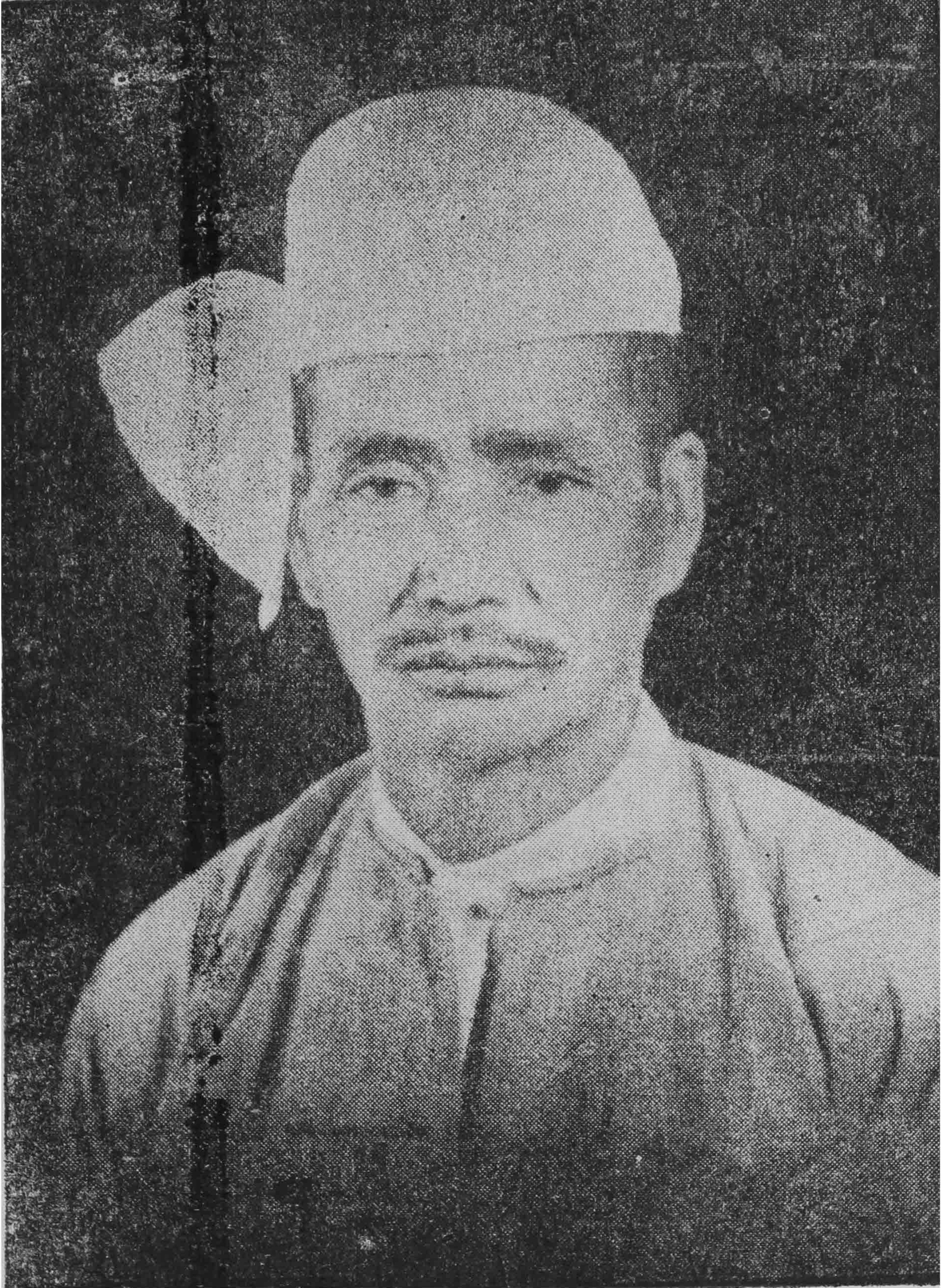
အကျိုးတော်ဆောင်, ဦးစိန်စိန်။