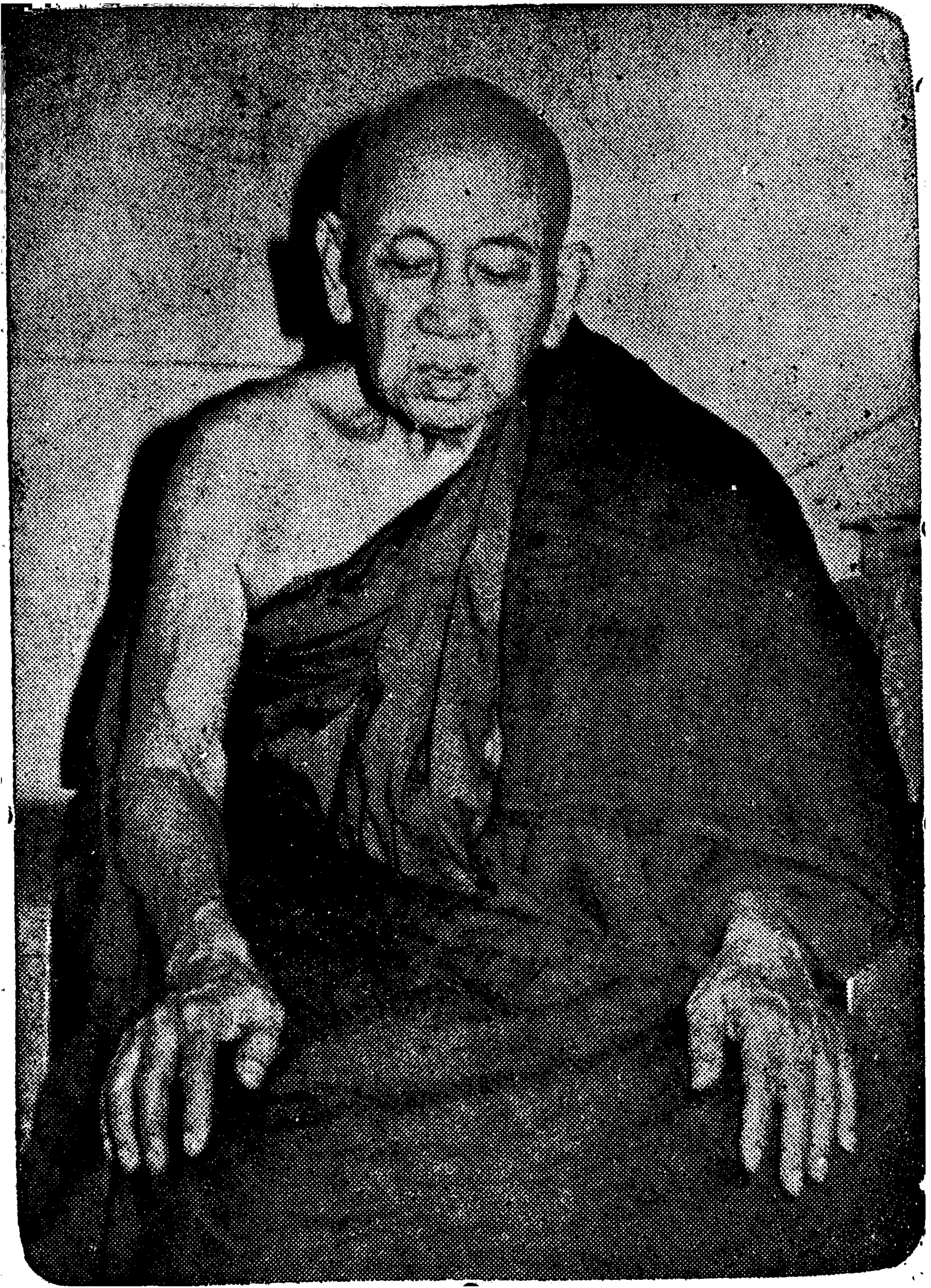
ခန္တိးဆရာတော်ဘုရားကြီး