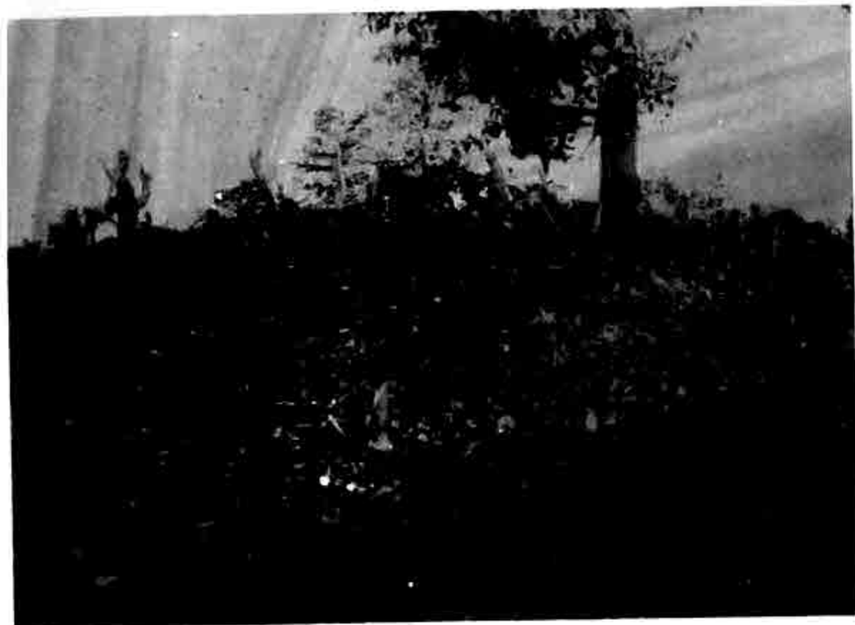
ရွှေပေထုပ်တွေ့ရှိသောနေရာ