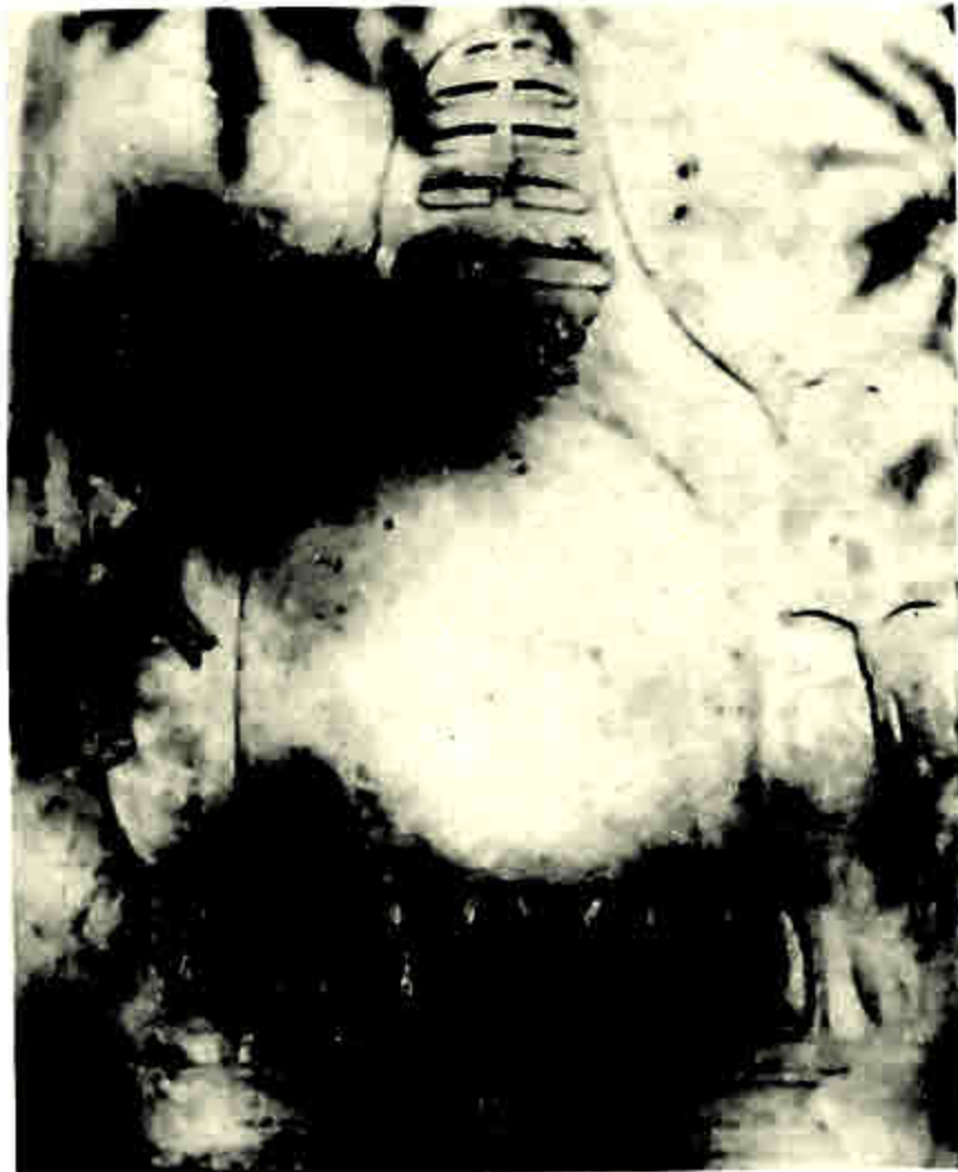
ဌာပနာတိုက်ကို ဖုံးအုပ်ထားသောကျောက်ပြား