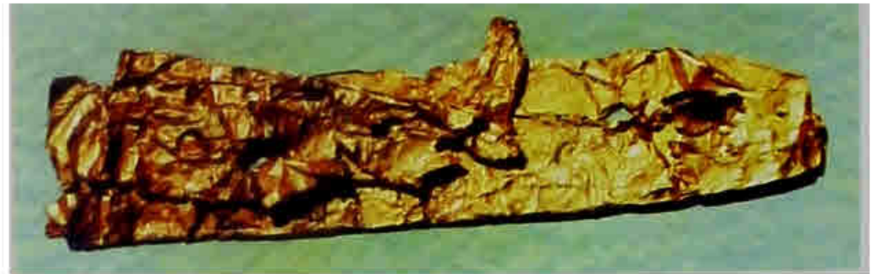
ရွှေပေချပ်မျှားကို ဖုံးအုပ်ထားသော ရွှေပြားနှစ်ချပ်