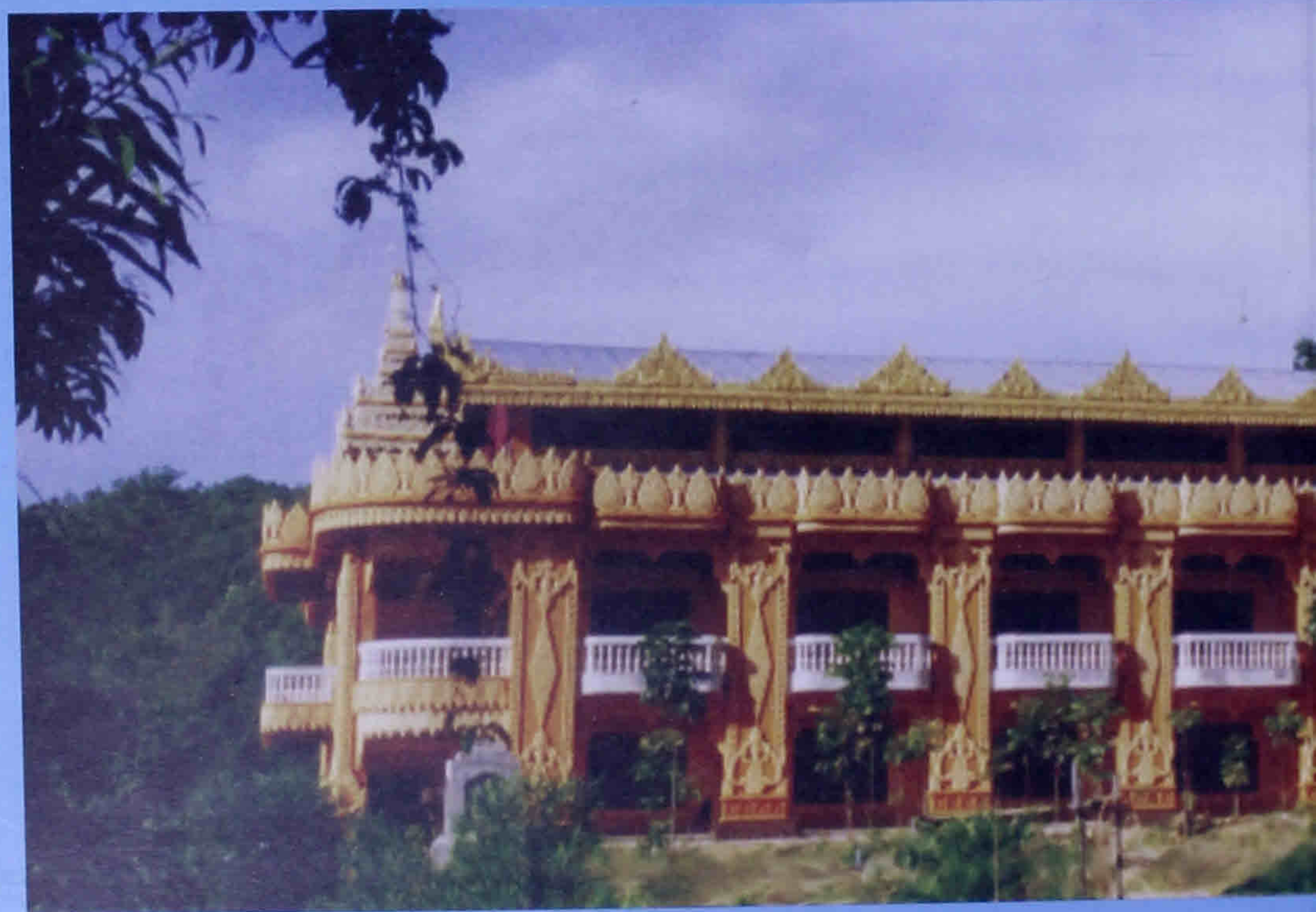
ဓမ္မဝိဟာရီသိမ်တော်ကြီး၊ ခိတ္တလတောင်ကျောင်း DR