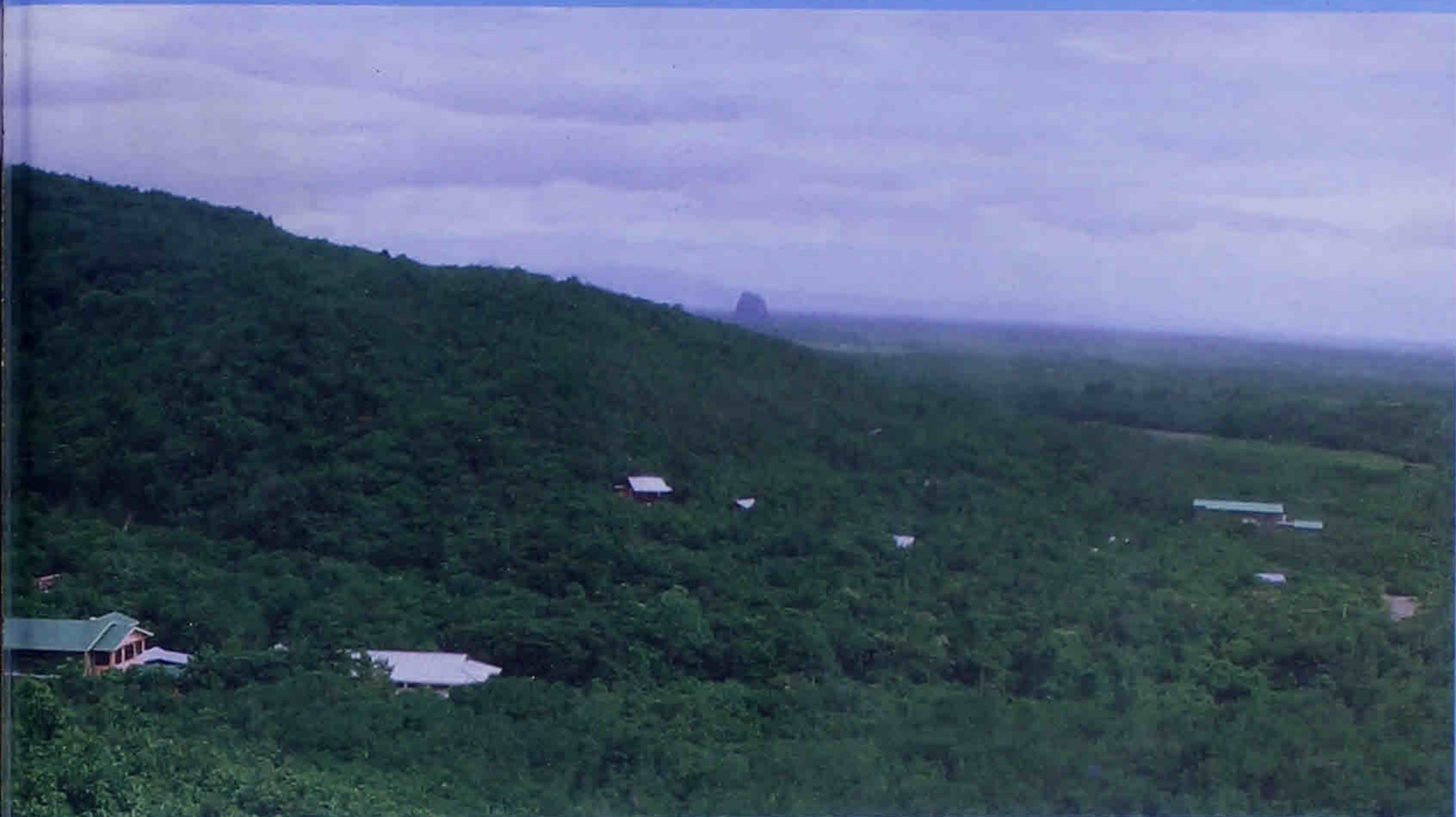
ဘဏ္ဍာရေဗုဒ္ဓသာသနာ့ရိပ်သာ a Buddhasāsana Meditation Centre