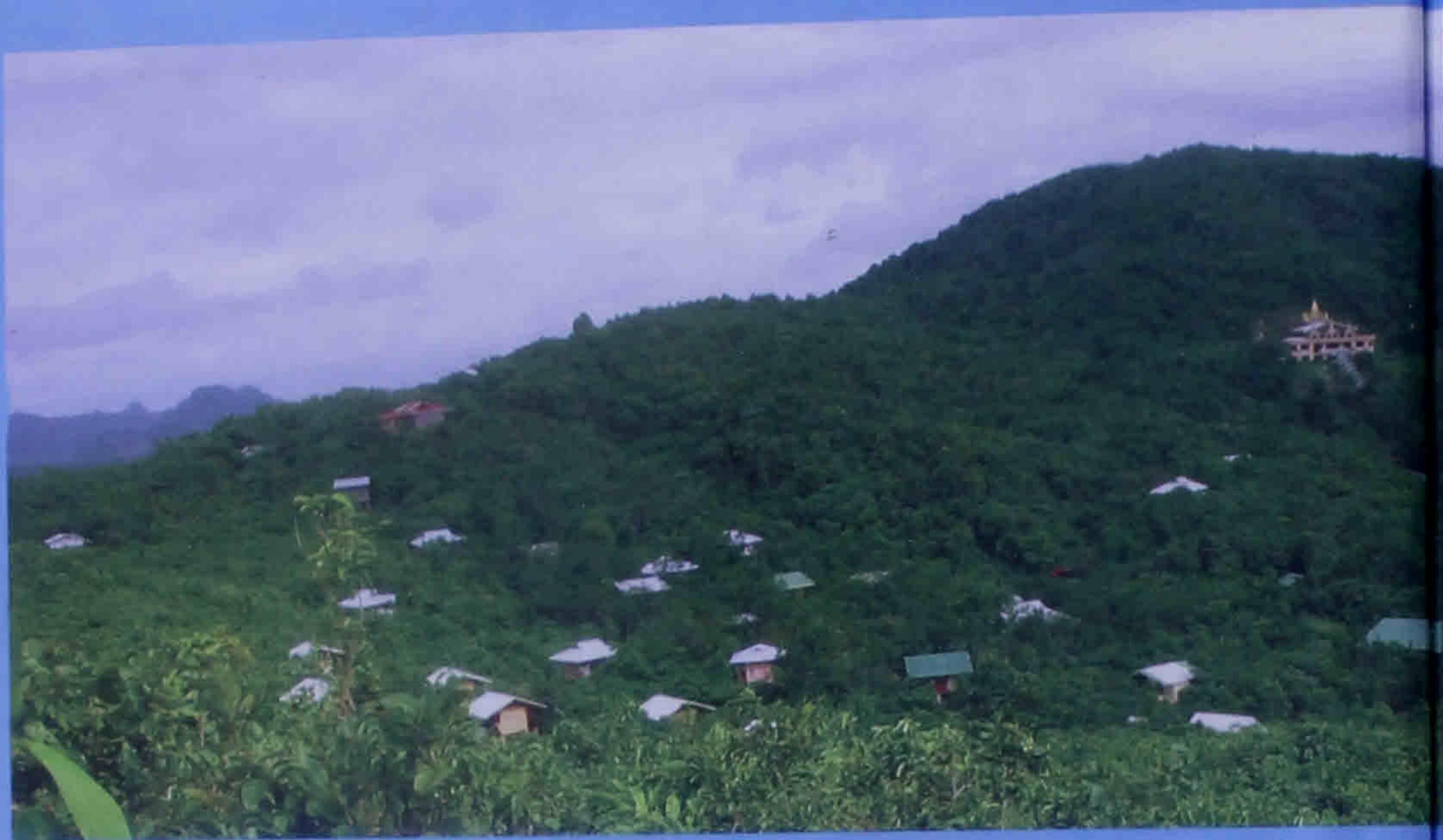
ခိတ္တလတောင်ကျောင်း၊ ဖားလ Cittalapabbatavihāra, Pa-Auk Ta