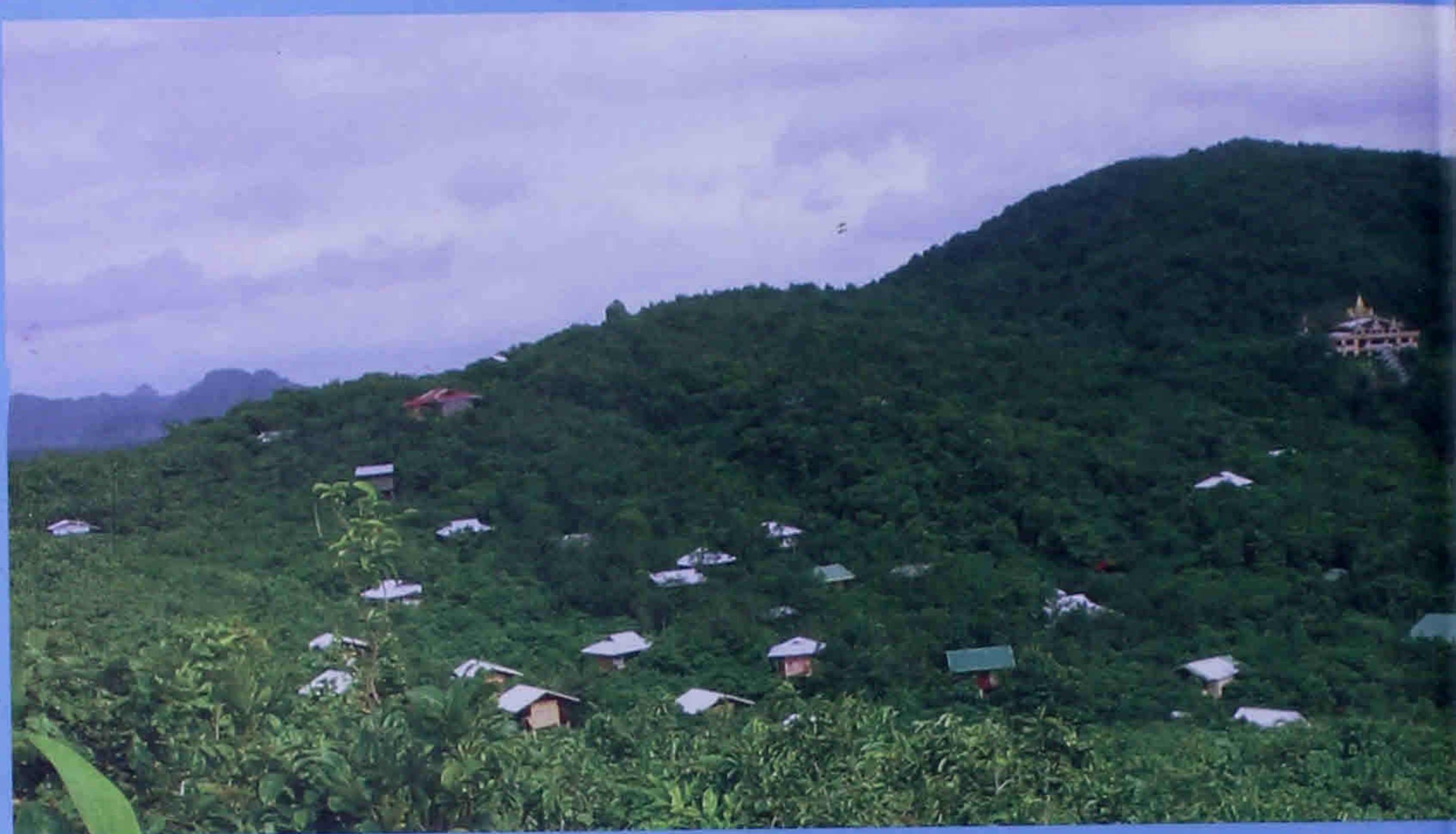
ခိတ္တလတောင်ကျောင်း၊ ဖား Cittalapabbatavihāra, Pa-Auk Ta