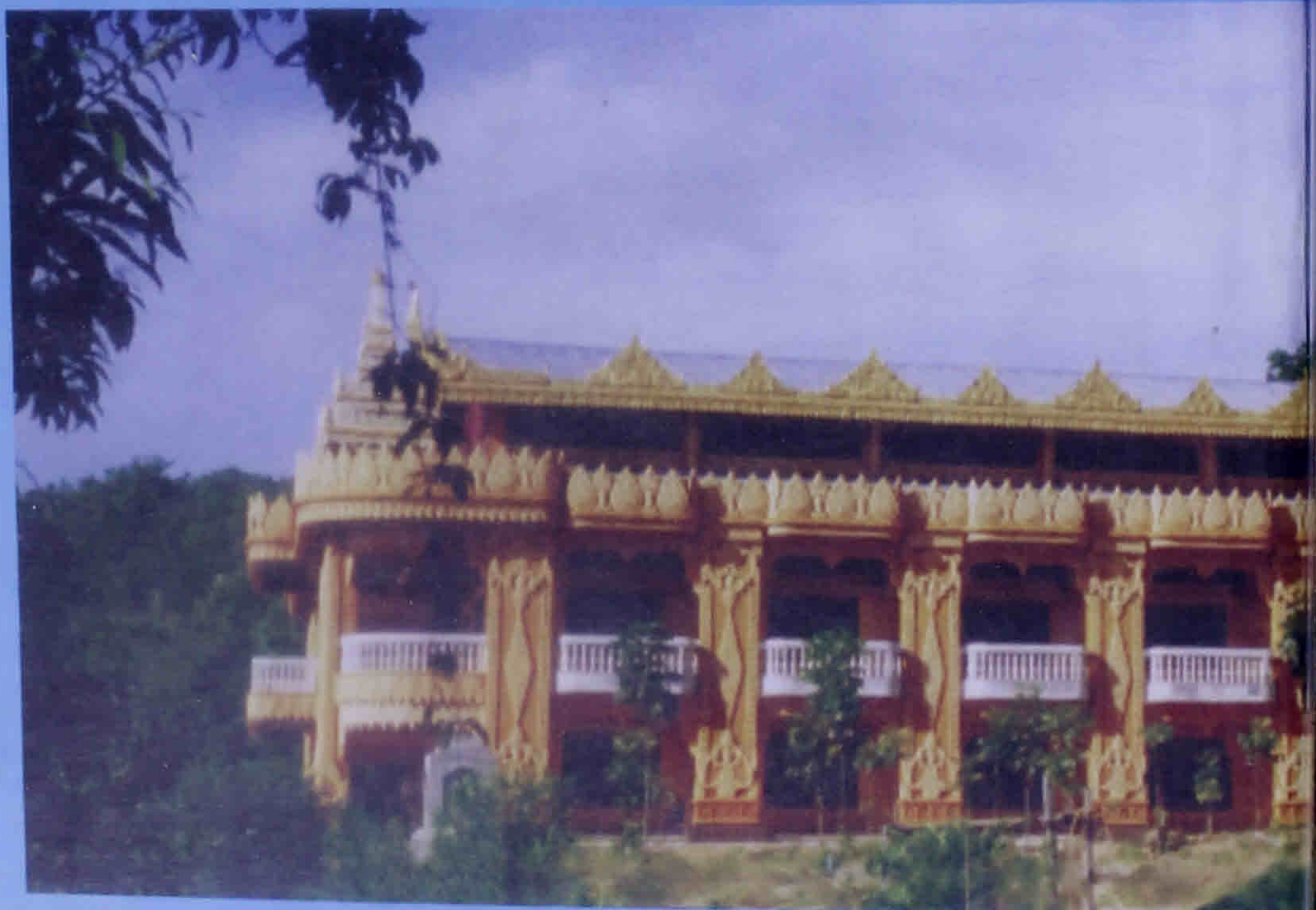
မွေဝိဟာရီသိမ်တော်ကြီး၊ ခိတ္တလတောင်ကျောင်း Dh