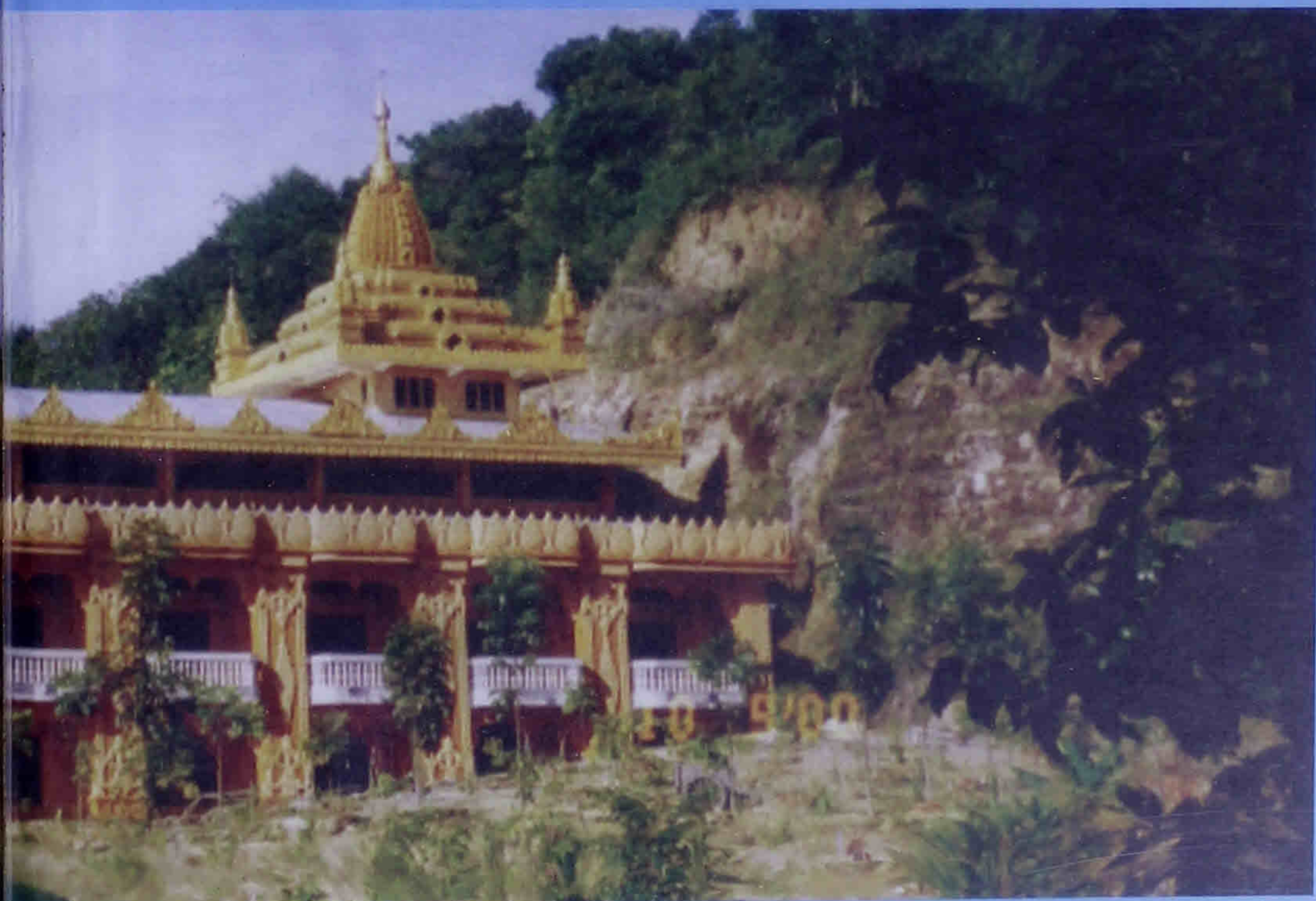
Amavihārī Sīmā, Cittalapabbatavihāra,