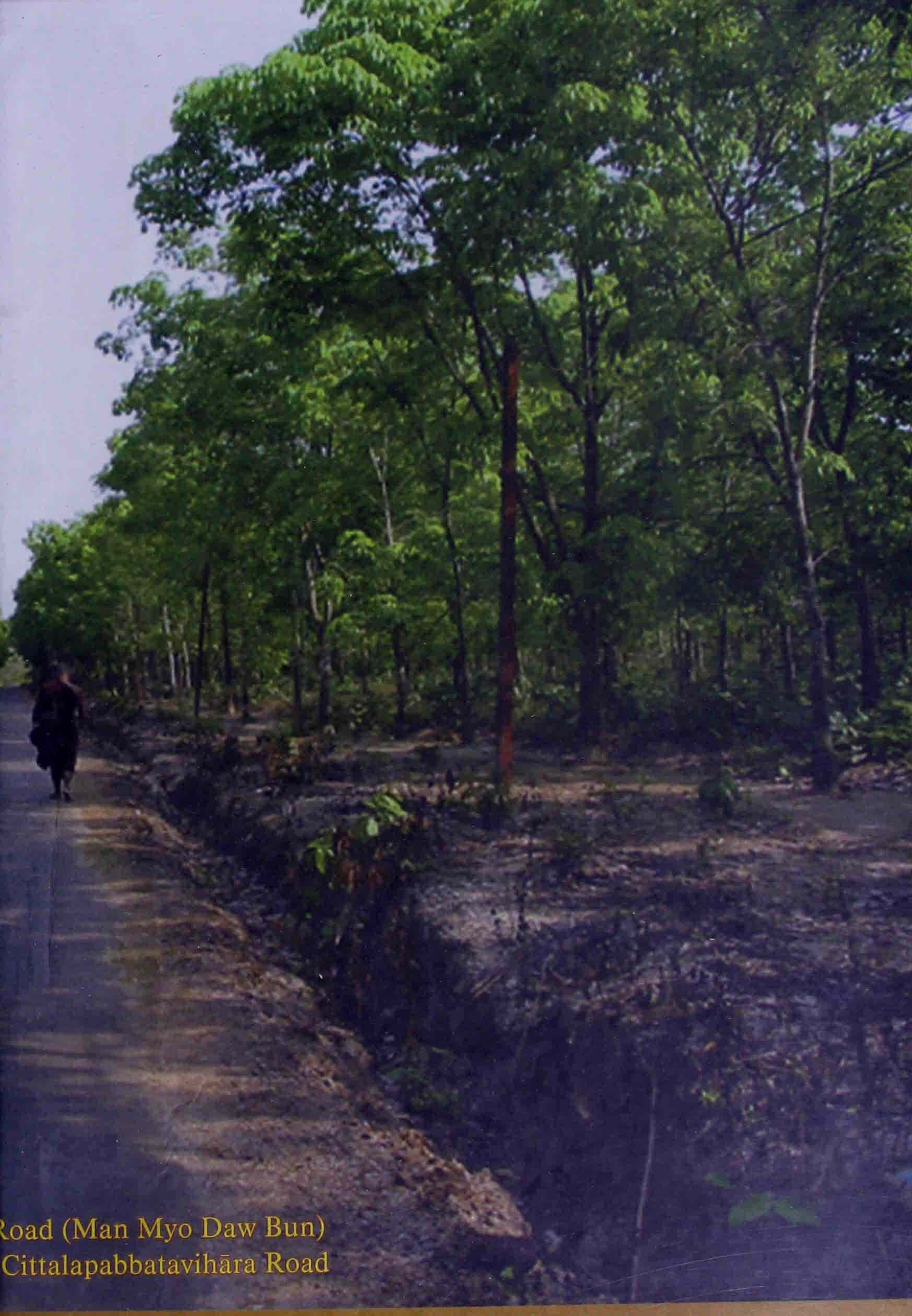
Road (Man Myo Daw Bun) Cittalapabbatavihāra Road