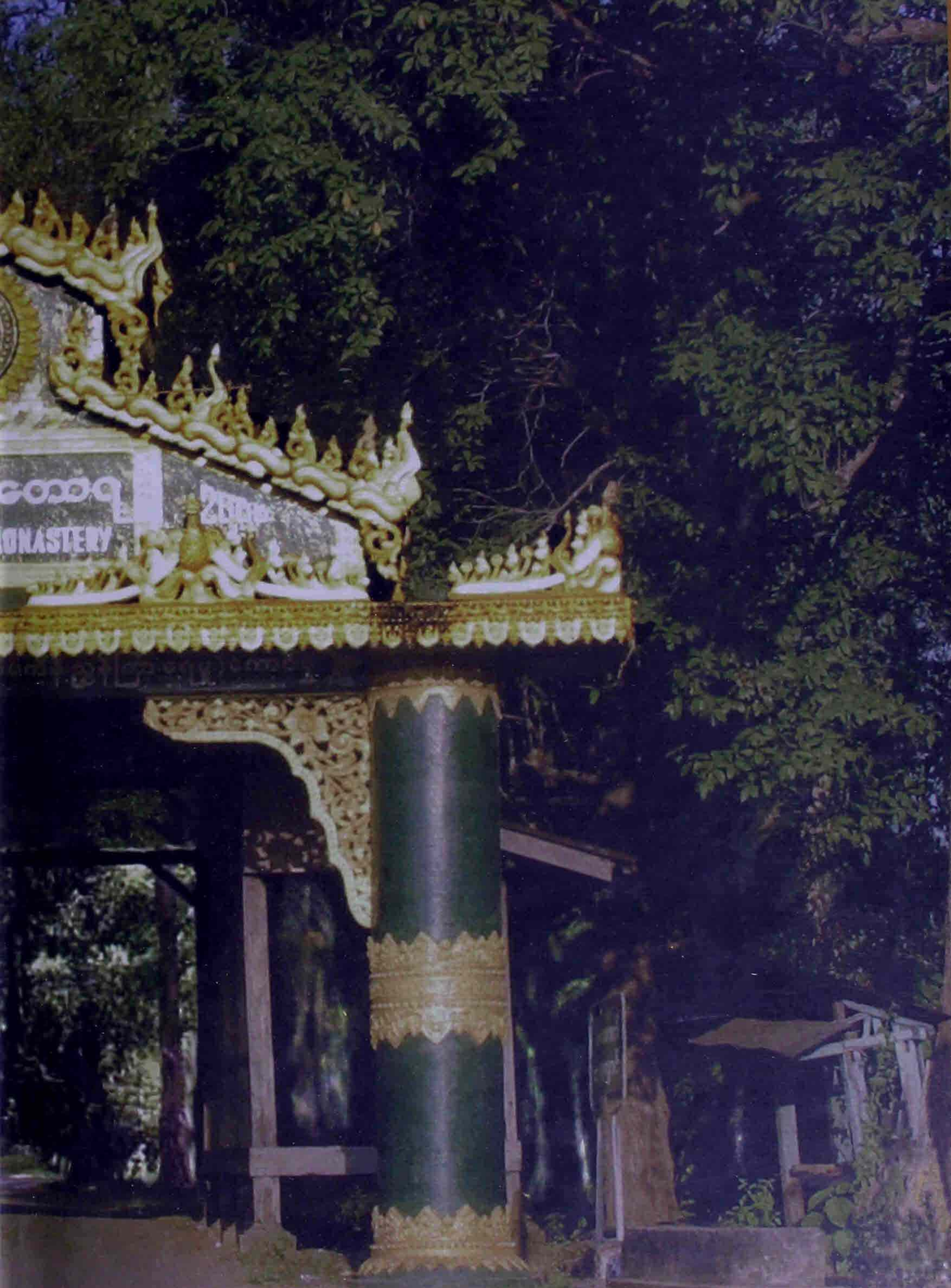
ဝိပဿနာနာရိပ်သာအဝင်အထွက်ဦး Āsana Meditation Centre Entrance