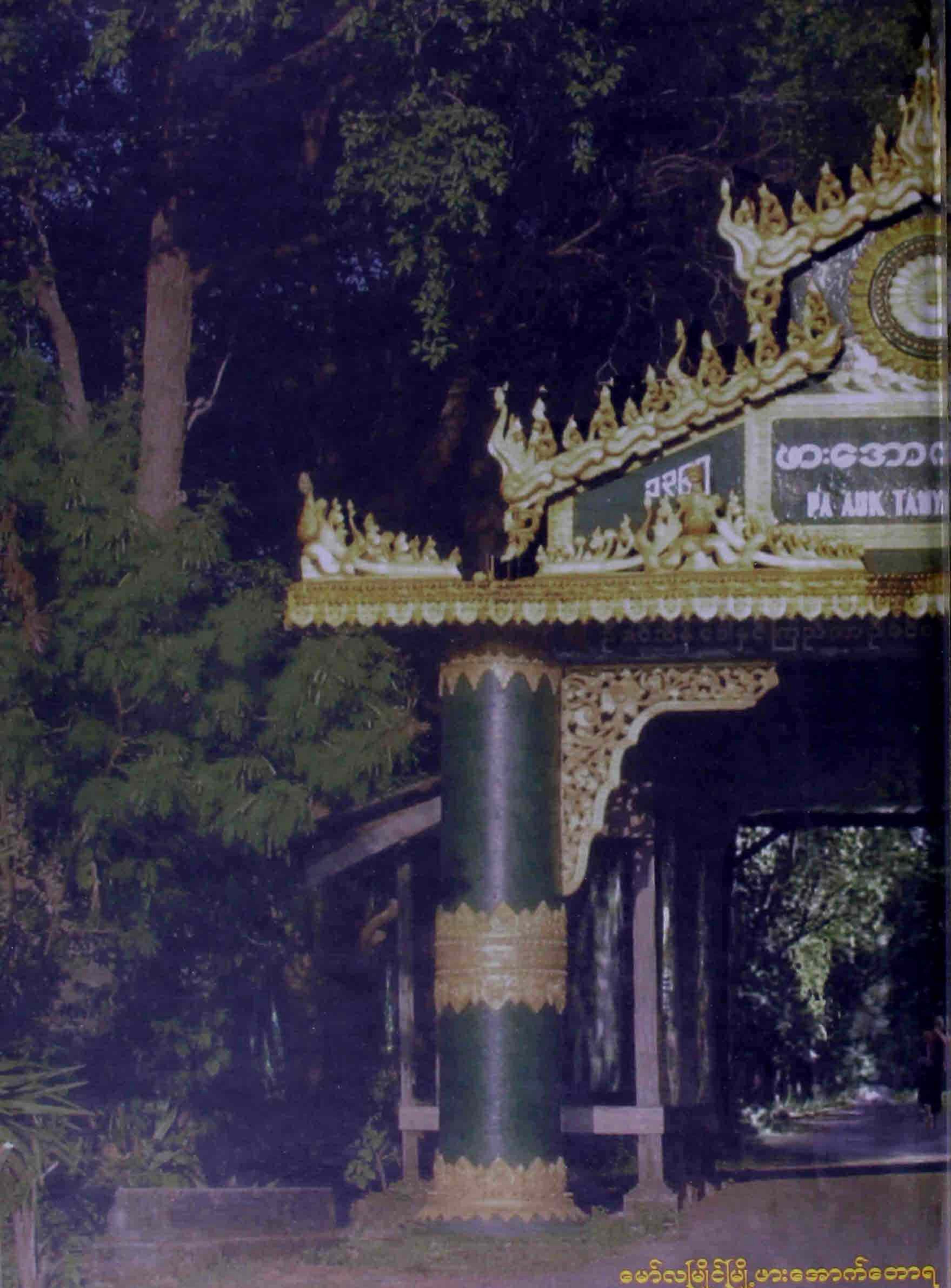
မော်လမြိုင်မြို့၊ မားအောက်တောရ MawLaMyine Pa-Auk Tawya Buddh