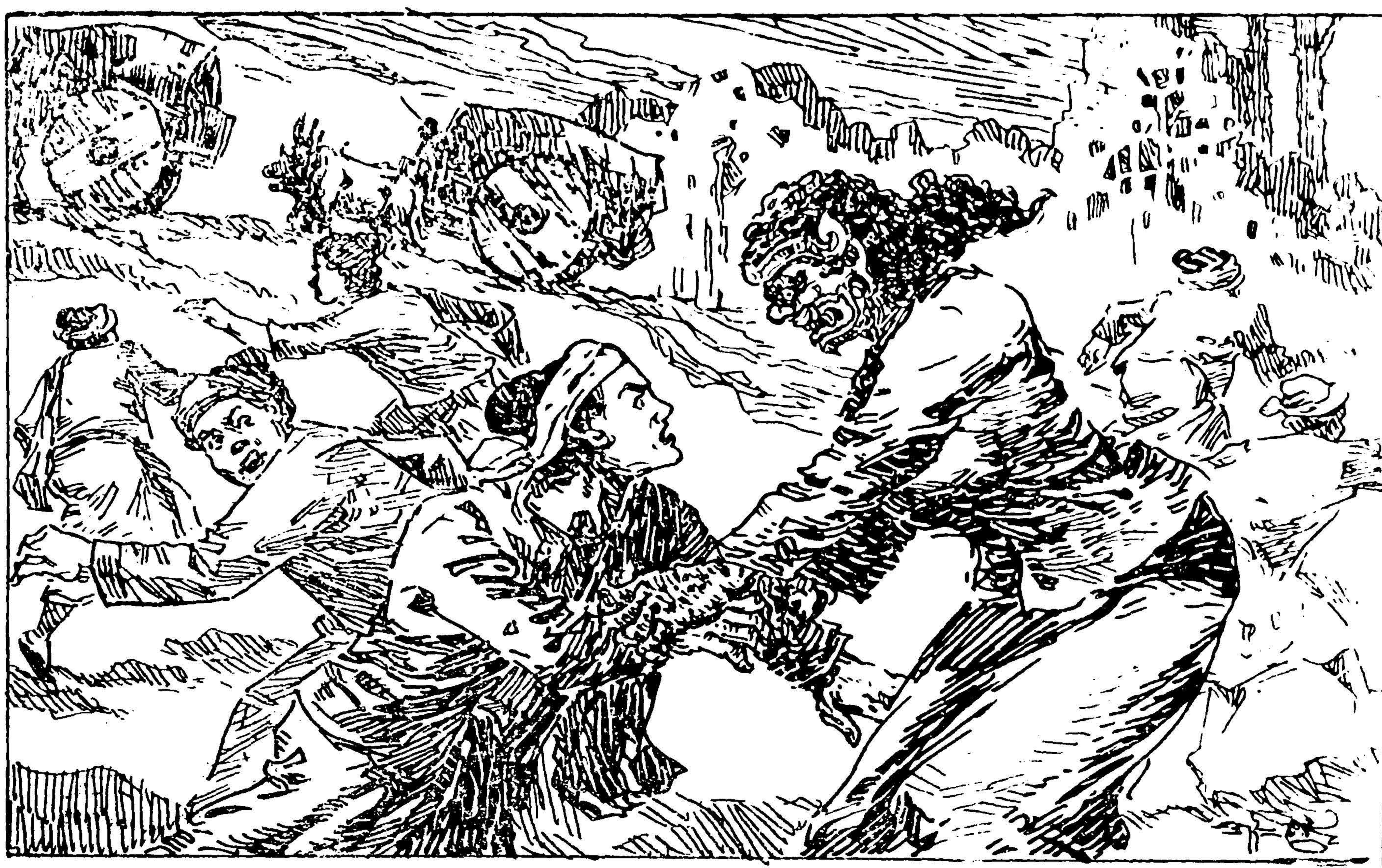
[စန္ဒမုခီ ဘိလူးမနှင့် ပုဏ္ဏားလုလင်ပုံ]