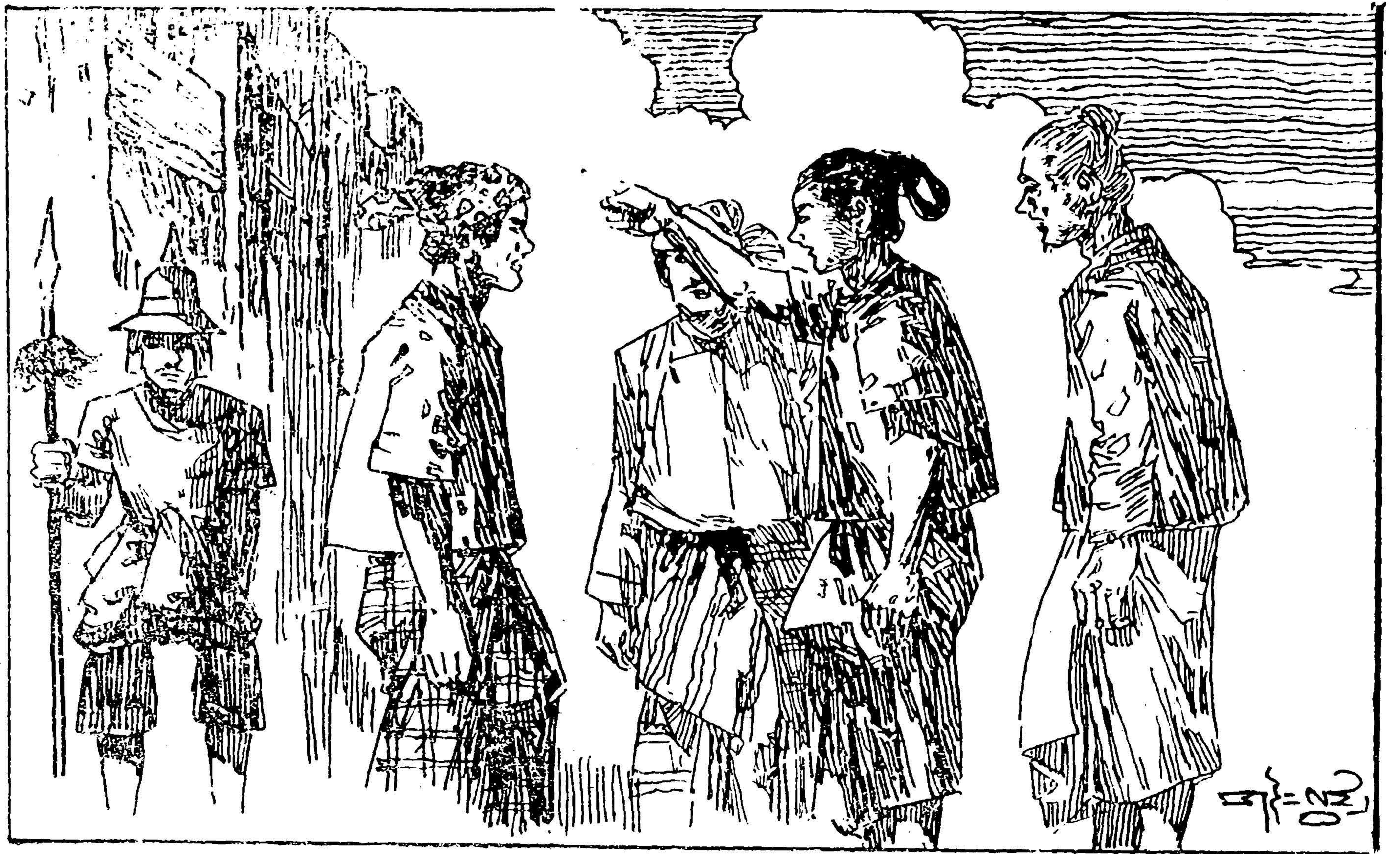
[ပုဏ္ဏားကြီးနှင့် သားလေးတို့သည် တိုင်းပြည်မှလူများကို ပြောပြနေပုံ]