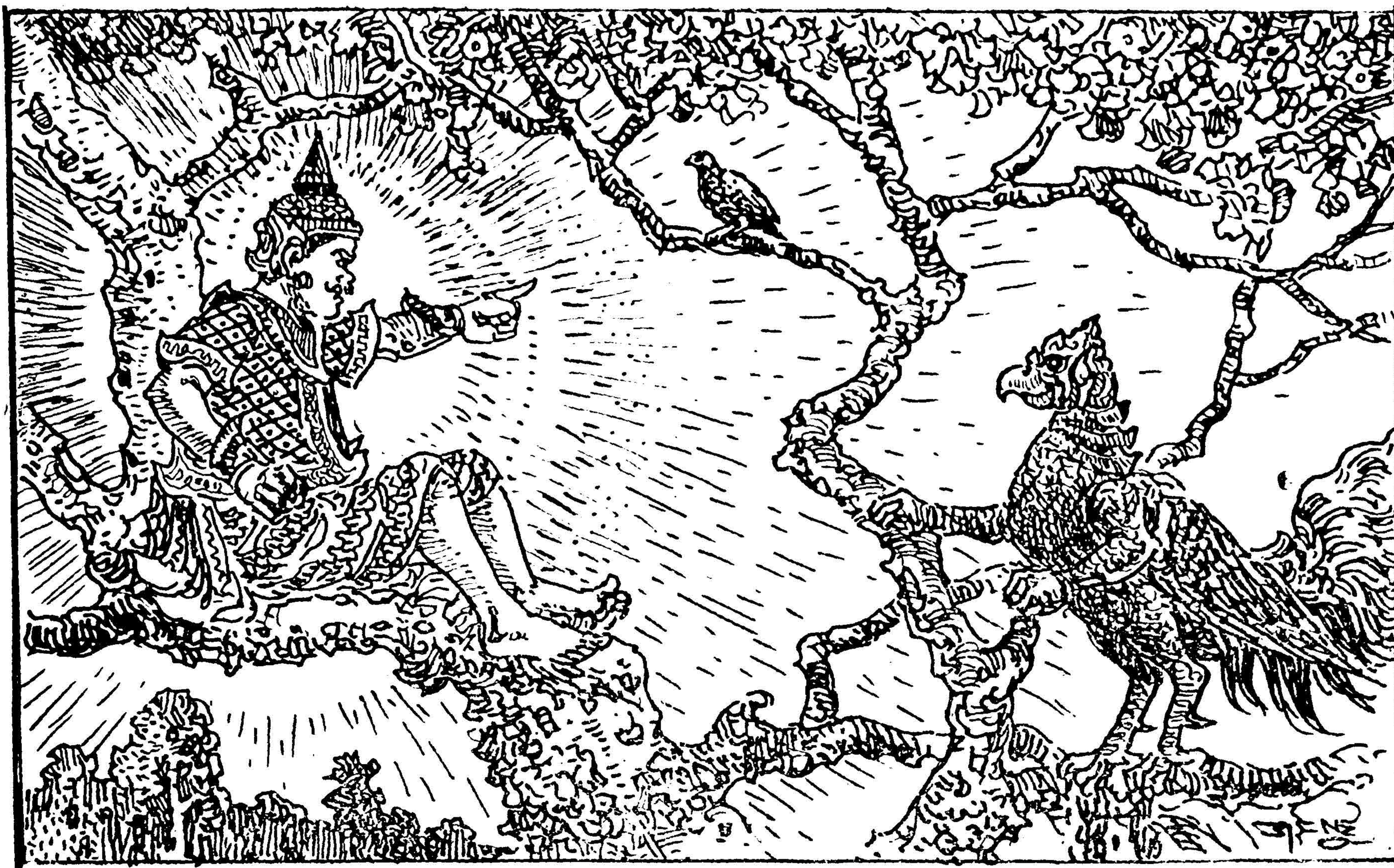
[ဂဠုန်သည် ရုက္ခစိုးအား မေးမြန်းနေပုံ] ၁၀၀၈