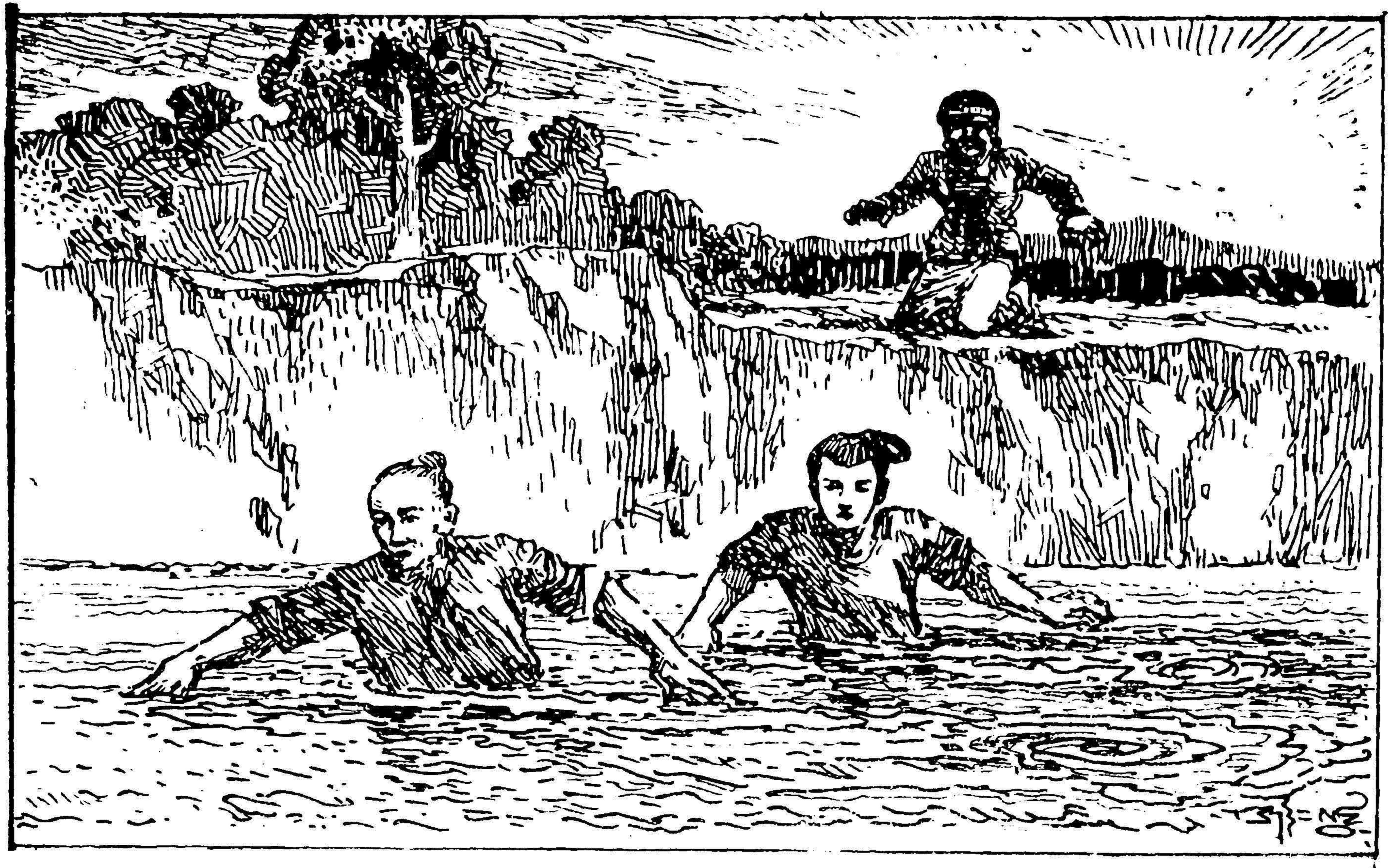
[ပုဏ္ဏားကြီးနှင့် သားလေးတို့သည် အမေတီလူးမကြီးထံမှ ပြေးကြပုံ]