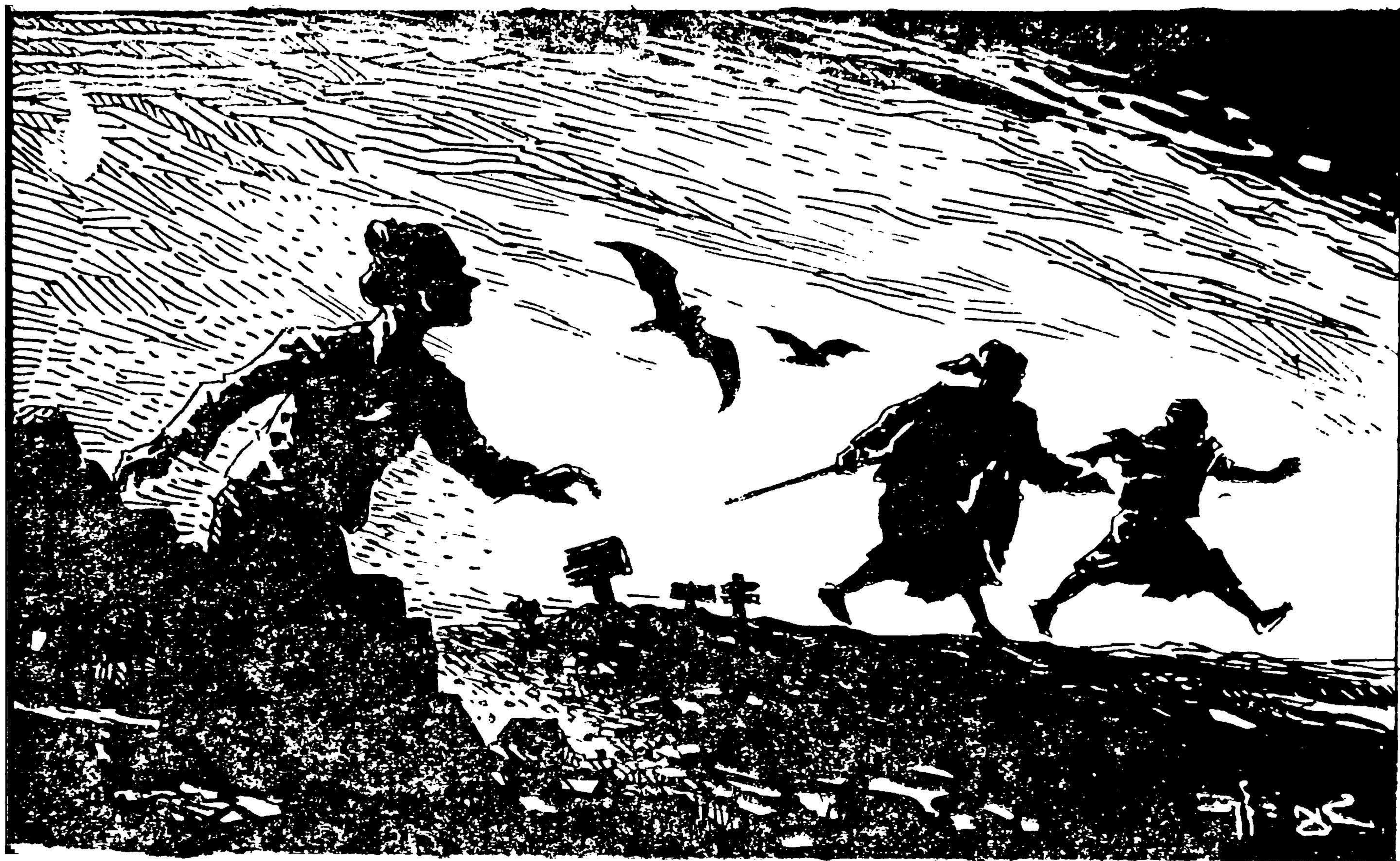
[အမယ်အိုနှင့် ဆေးဆရာ]