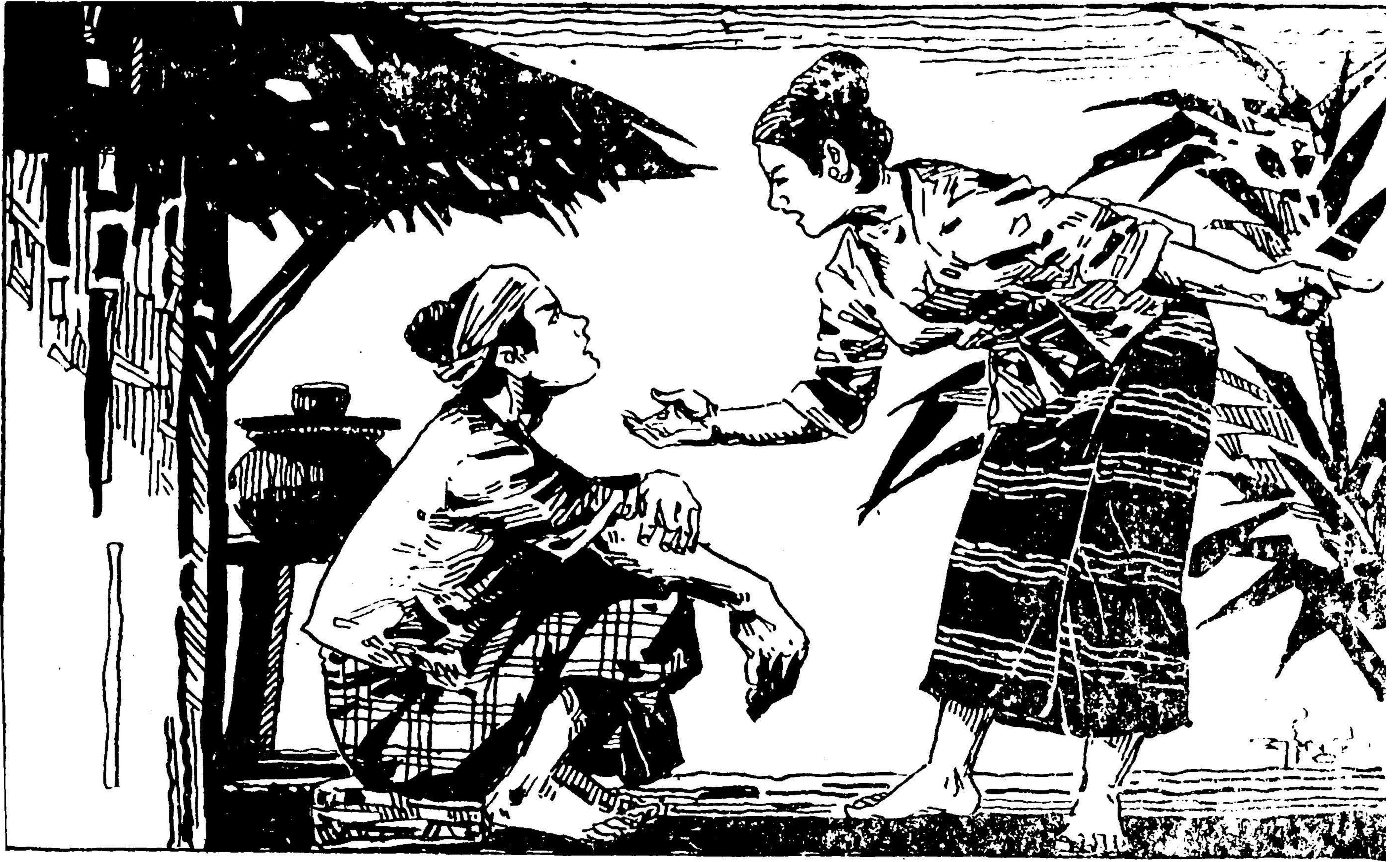
[လင်မယားနှစ်ယောက်]