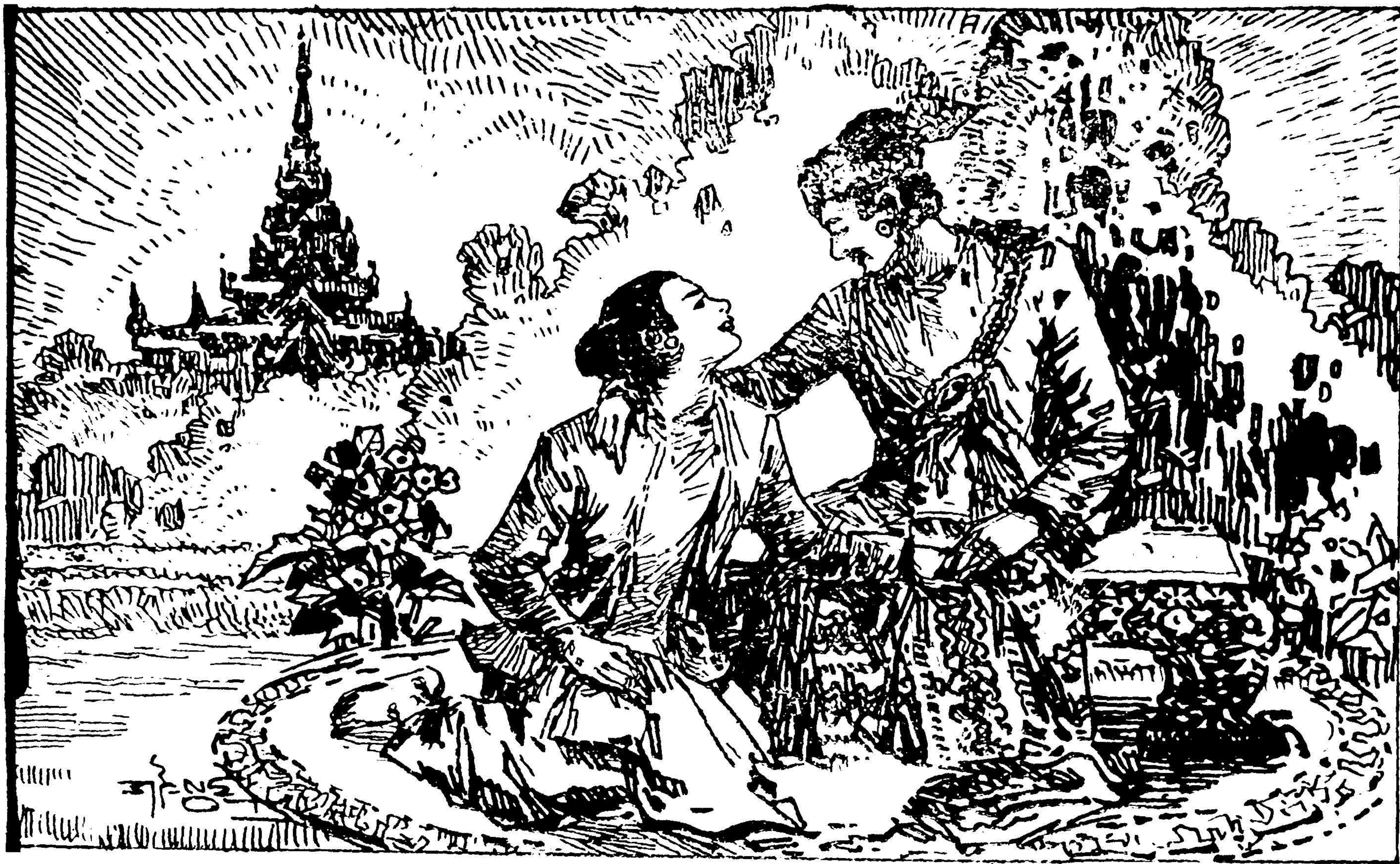
[၂၀၀၇ မင်းသားလေးသည် သူငယ်ချင်း ကောရကလမ္ဗကို ပြောနေပုံ]