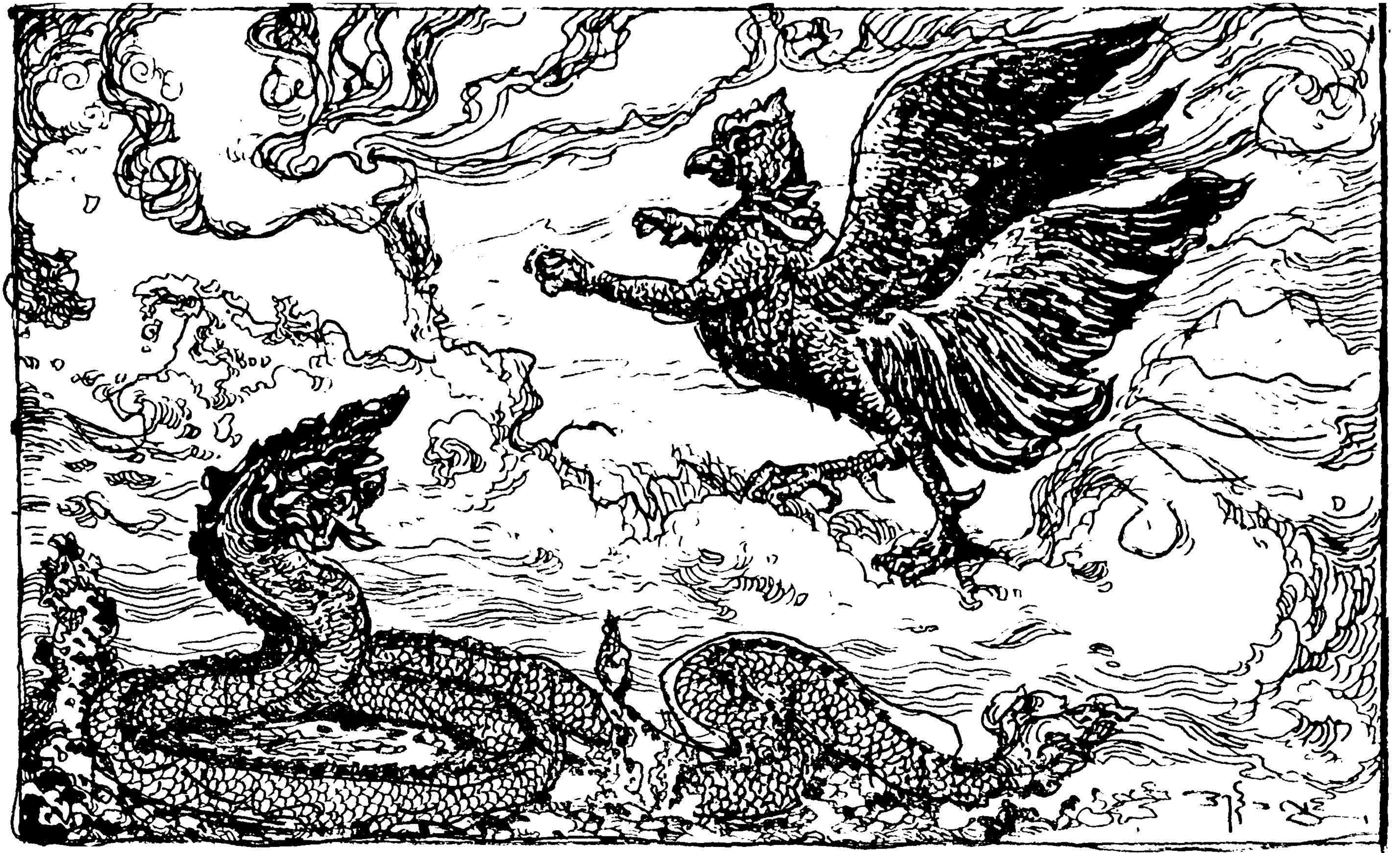
[၇၆၆၊ နဂါးပုံ]