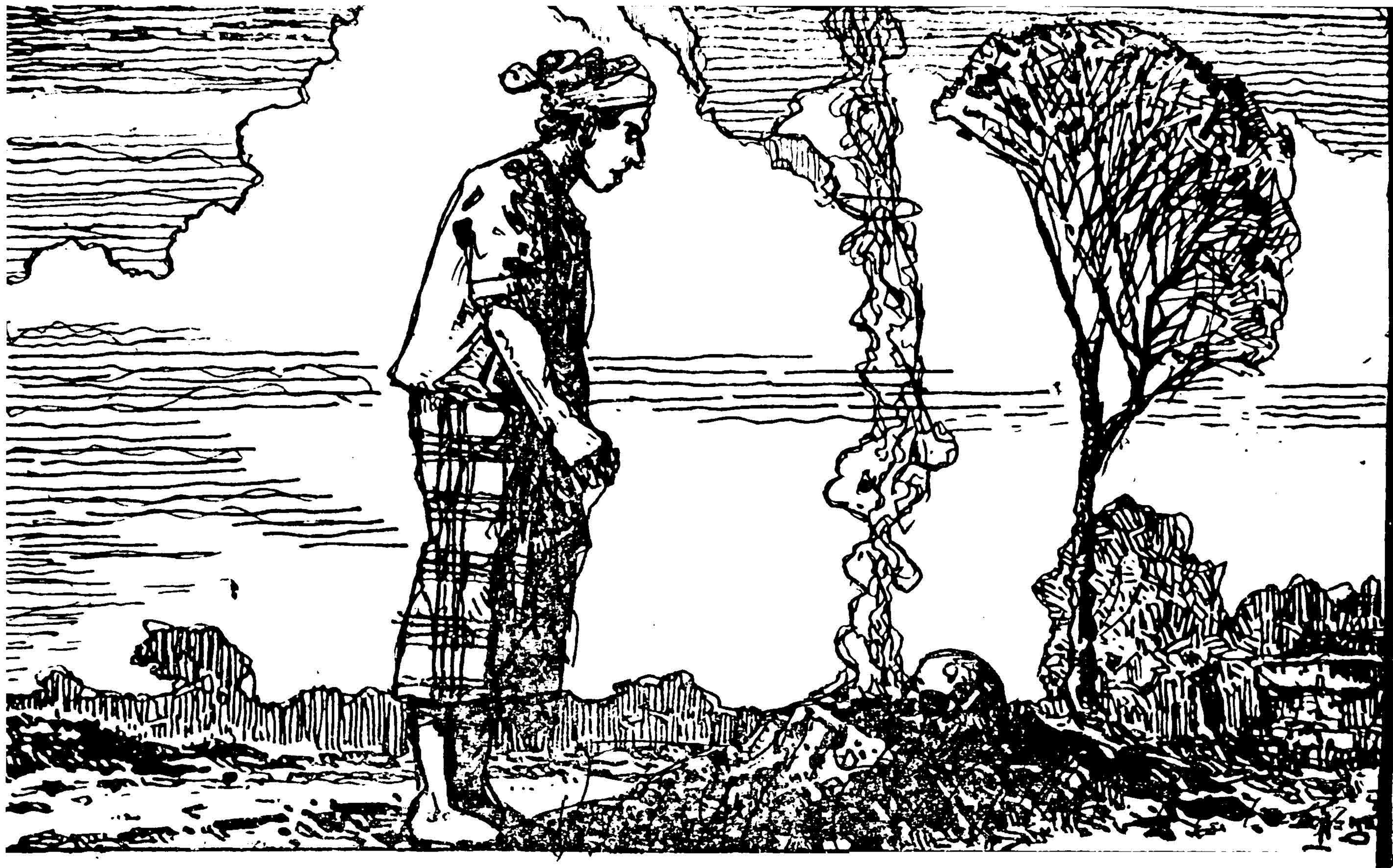
[မီးလောင်နေသော ဇနီးသည်အား ကြည့်နေပုံ]