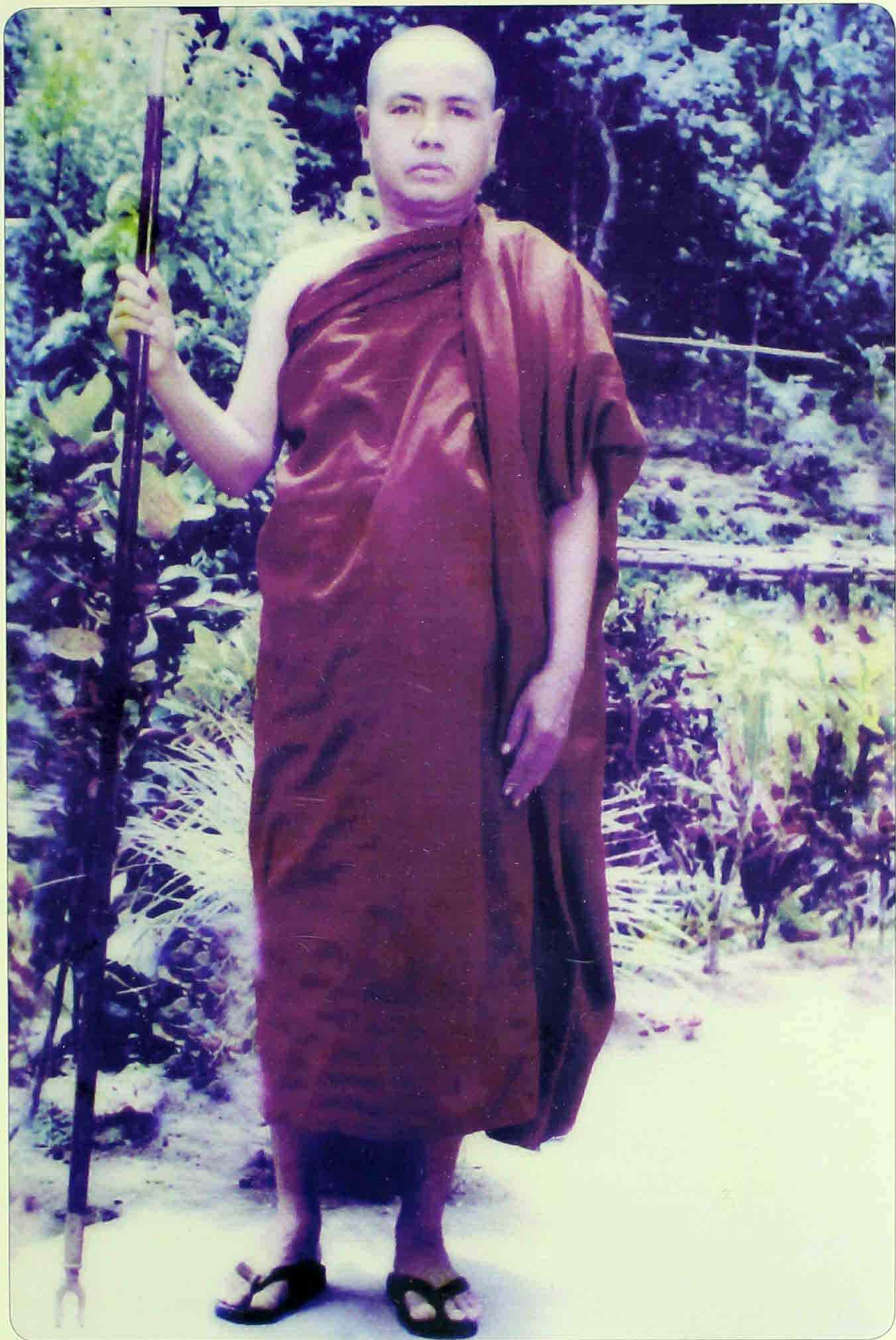
တောင်စွန်းမြို့ မေ့ဒုတတောရကျောင်းတိုက် ပဓာနနာယက ဆရာတော် ဝိသိဋ္ဌဒီဃဘာဏက သီရိပဝရဓမ္မာစရိယ အဂ္ဂမဟာသဒ္ဓမ္မဇောတိကဓဇ၊ အဂ္ဂမဟာ ဓမ္မကထိက ပိဋကတ္ထယပါရဂူ ဘဒ္ဒန္တပညာဇောတ