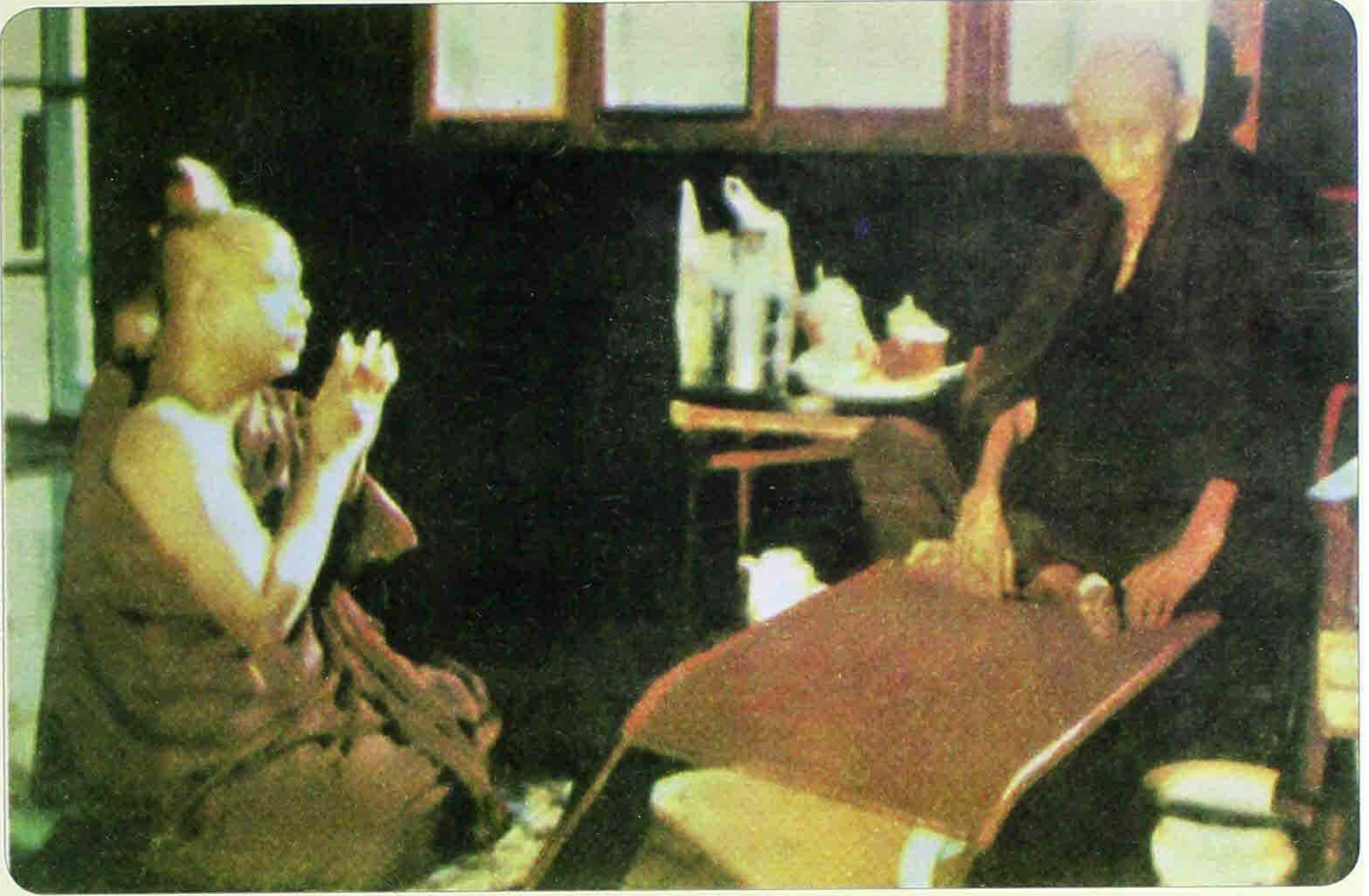
ရွှေဥမင် ဆရာတော်ဘုရားကြီးအား ဂါဝရပြုနေစဉ်