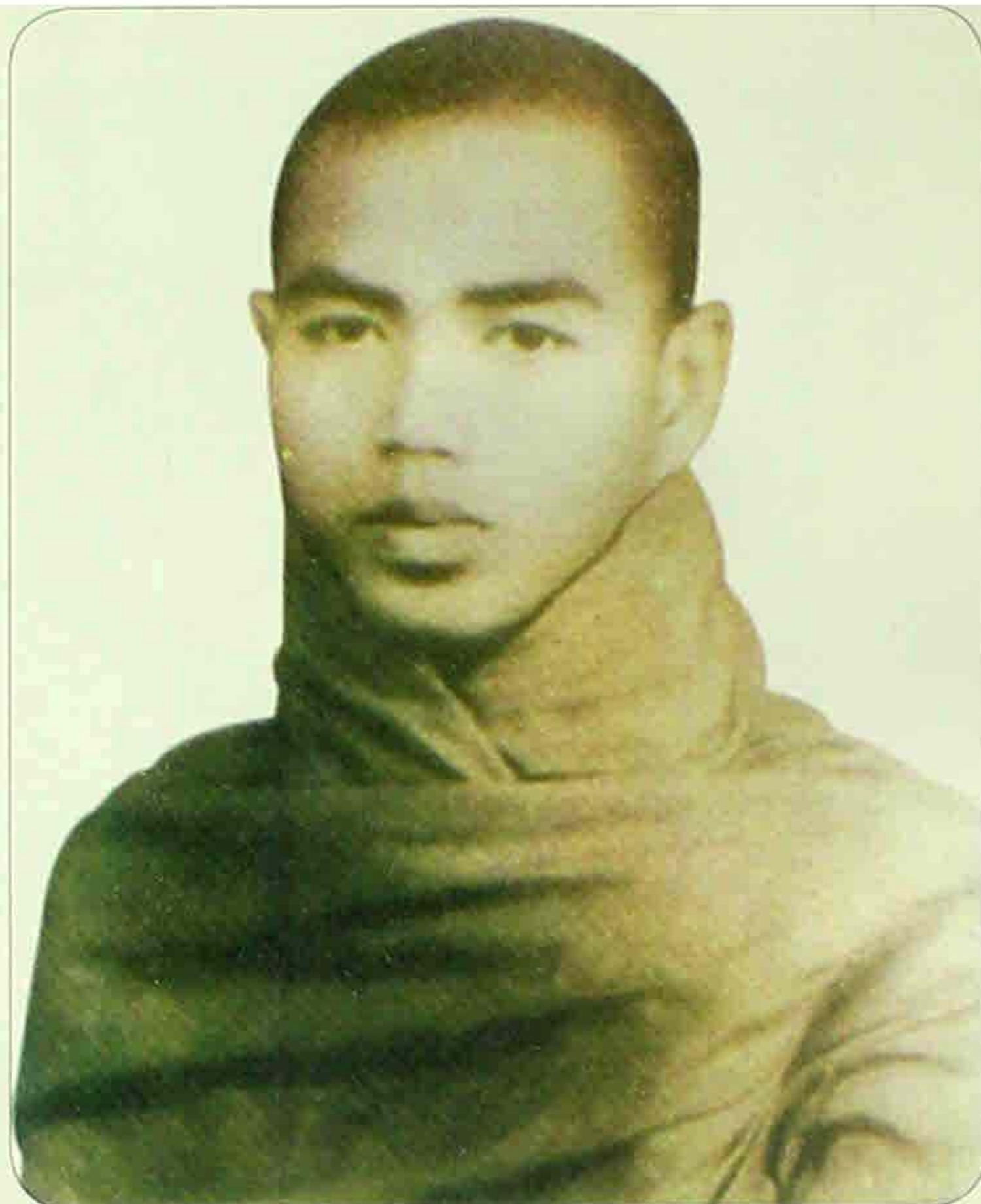
ဓမ္မဒူတအရှင်ပညာဇောတ ငယ်စဉ်က ပုံတော်