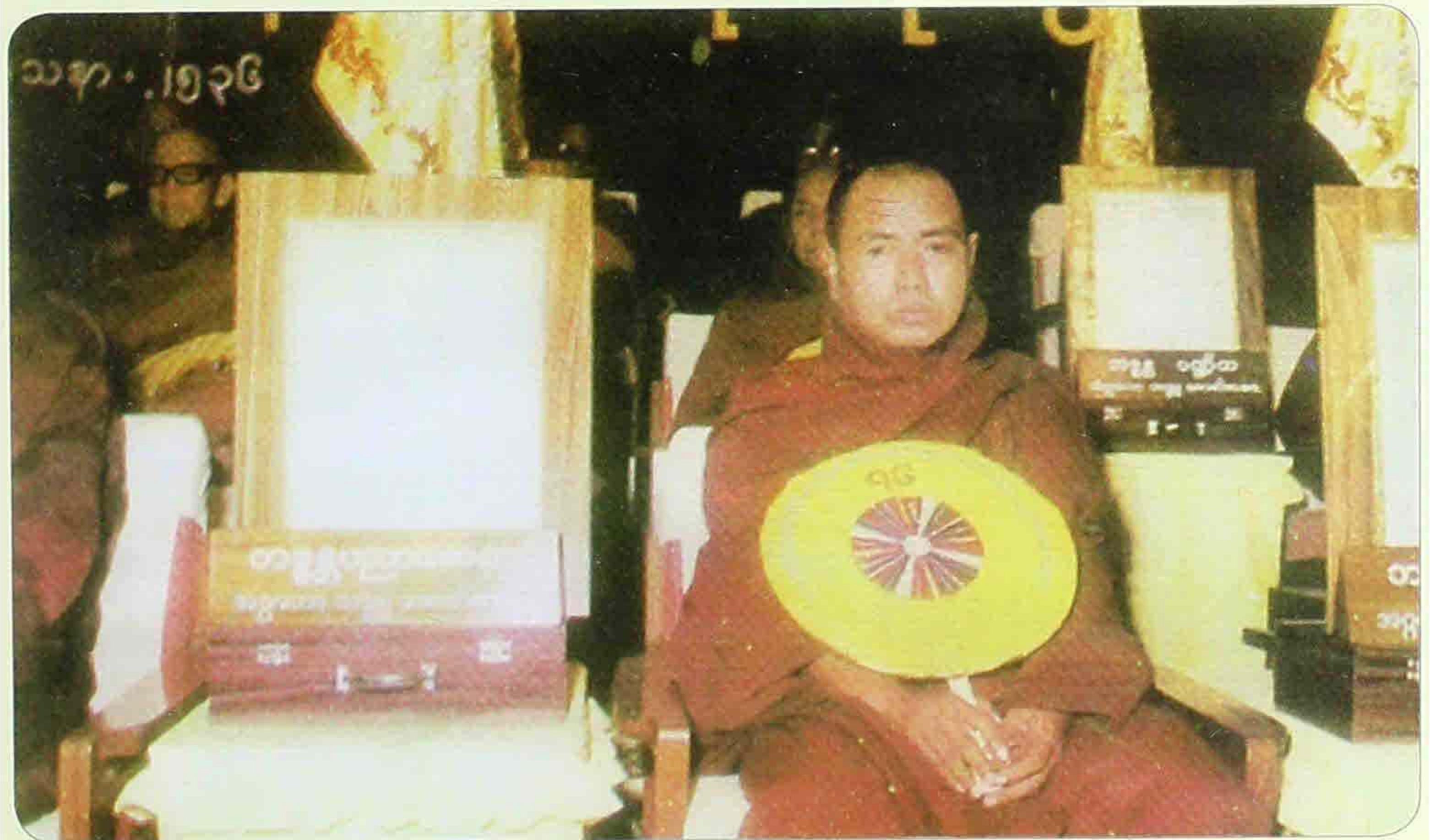
မဟာပါသာဏလိုဏ်ဂူတော်ကြီးအတွင်း၌ အကြည်ညိုခံယူနေစဉ်