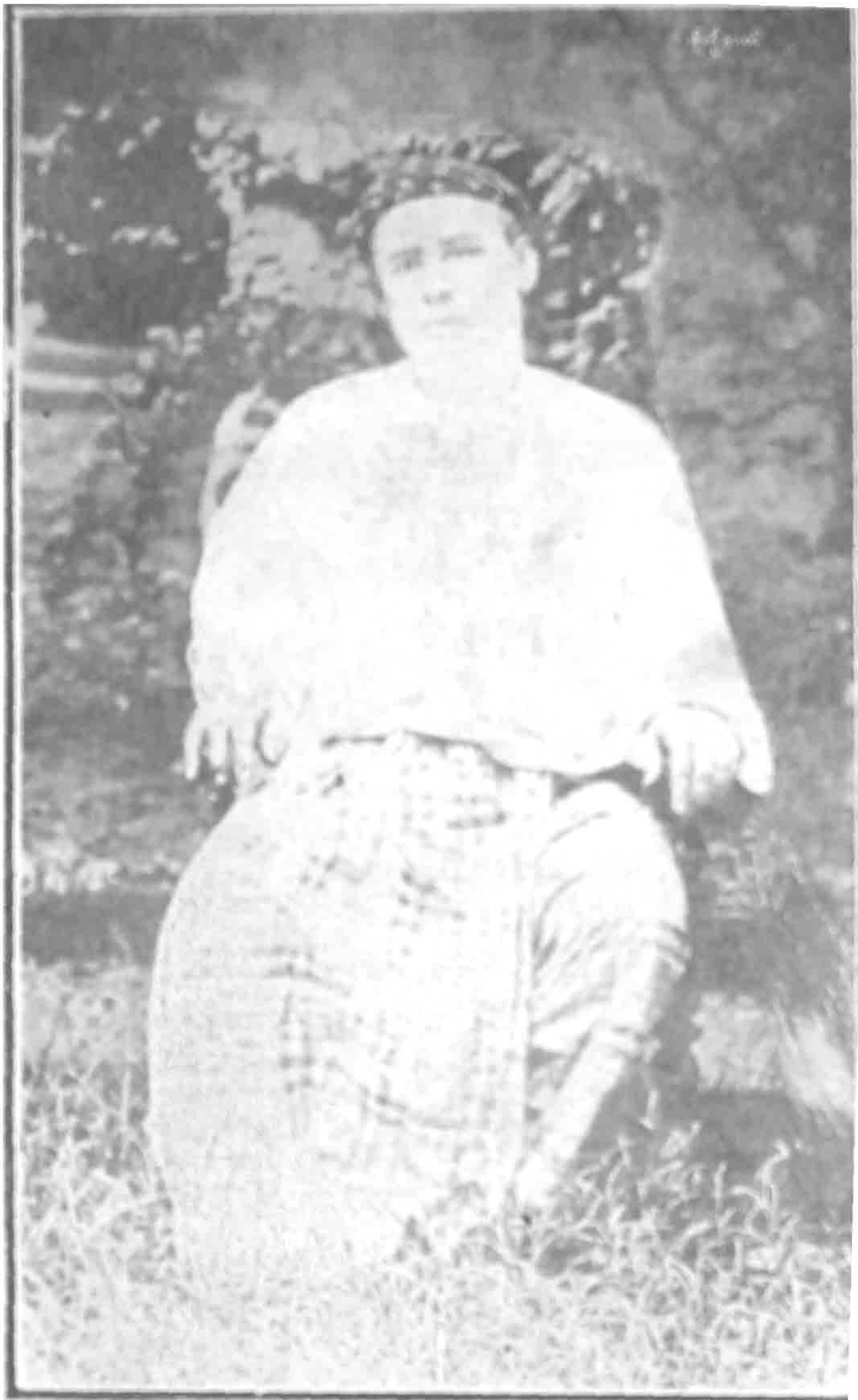
“ နေမျိုးမင်းကျော်စေယျသု ” တွဲ ခံ သံတော်ဆင့်မင်း ဦးကျော်စေး၏ပုံ၊