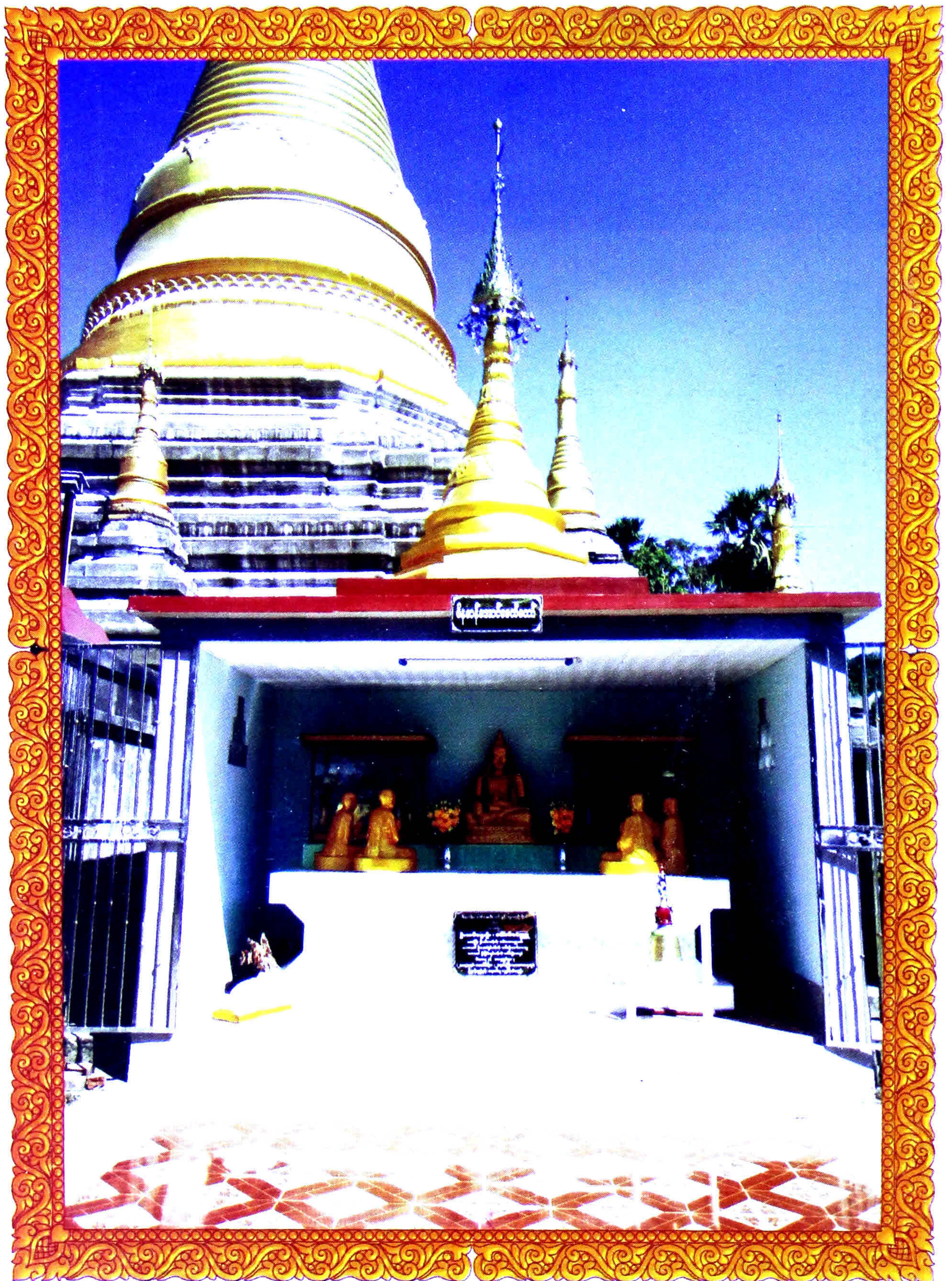
ဆားမလောက်ကျေးရွာမှ ဇိနမာရ်အောင်စေတီ