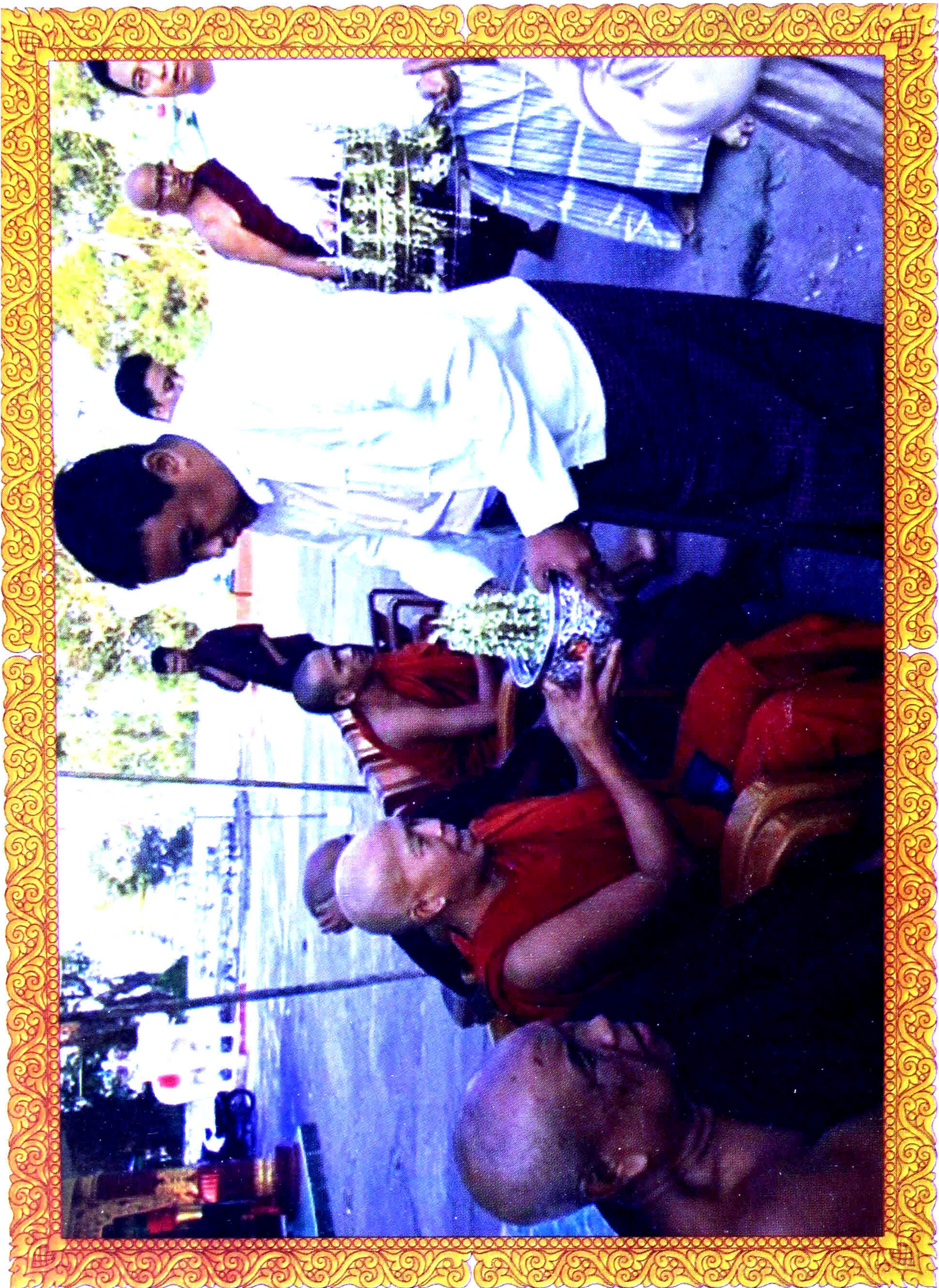
သား (၃)ဦးမှ ရွှေထီးတော်ကို သံဃာတော်သို့ ဆက်ကပ်စဉ်