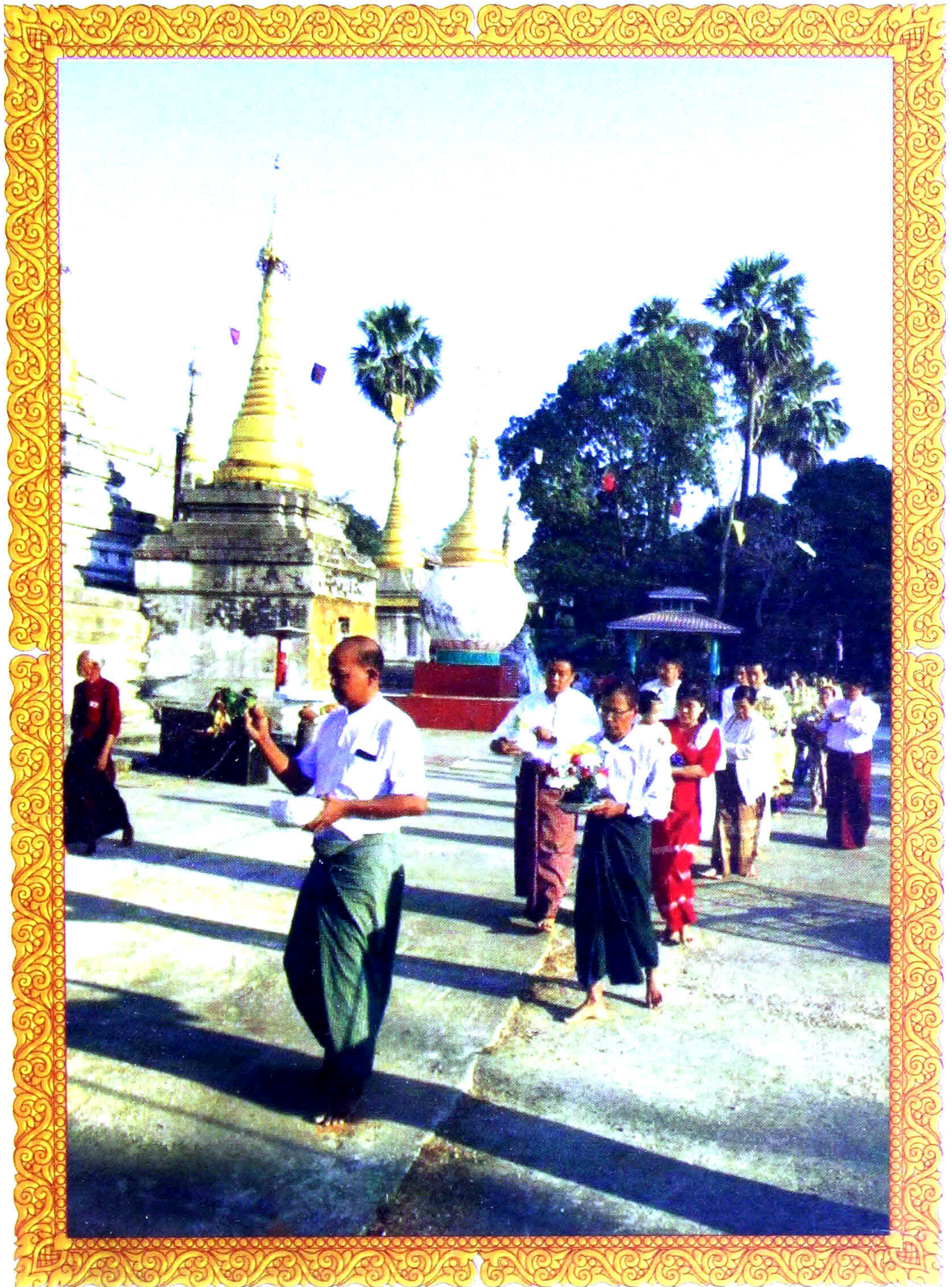
အလှူရှင်များ ရွှေထီးအစိတ်အပိုင်းတို့ကို လှည့်လည် ပူဇော်ကြစဉ်