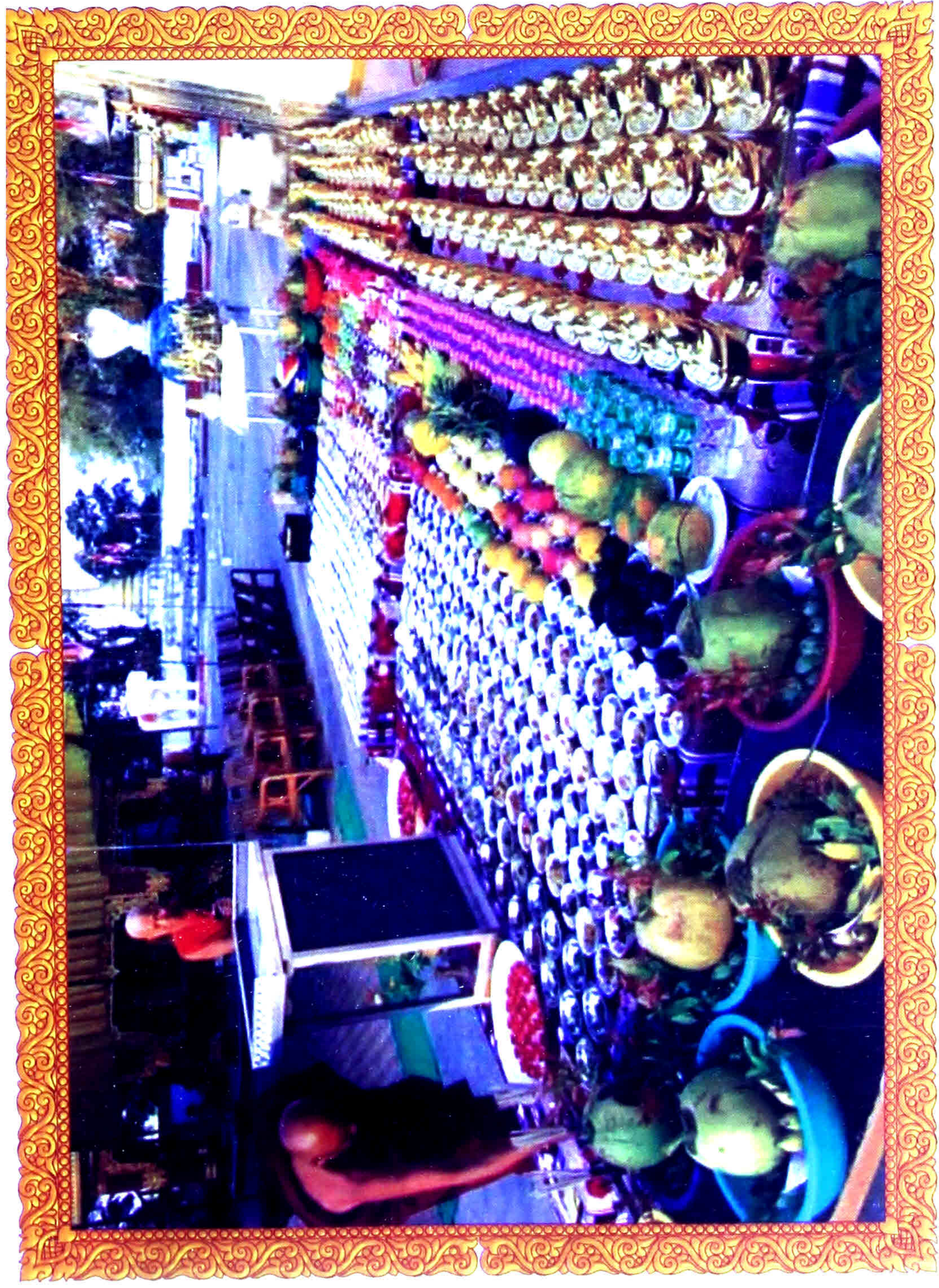
ဇိနမာရ်အောင်စေတီ ရွှေထီးတင်ပွဲ၌ ဗုဒ္ဓခြေတော်ရာအား ကပ်လှူရန် ဆွမ်းငှေတံပွဲ (၁၀၀၀)ကျော် ပြင်ဆင်ထားစဉ် (၂-၂-၂၀၁၇)