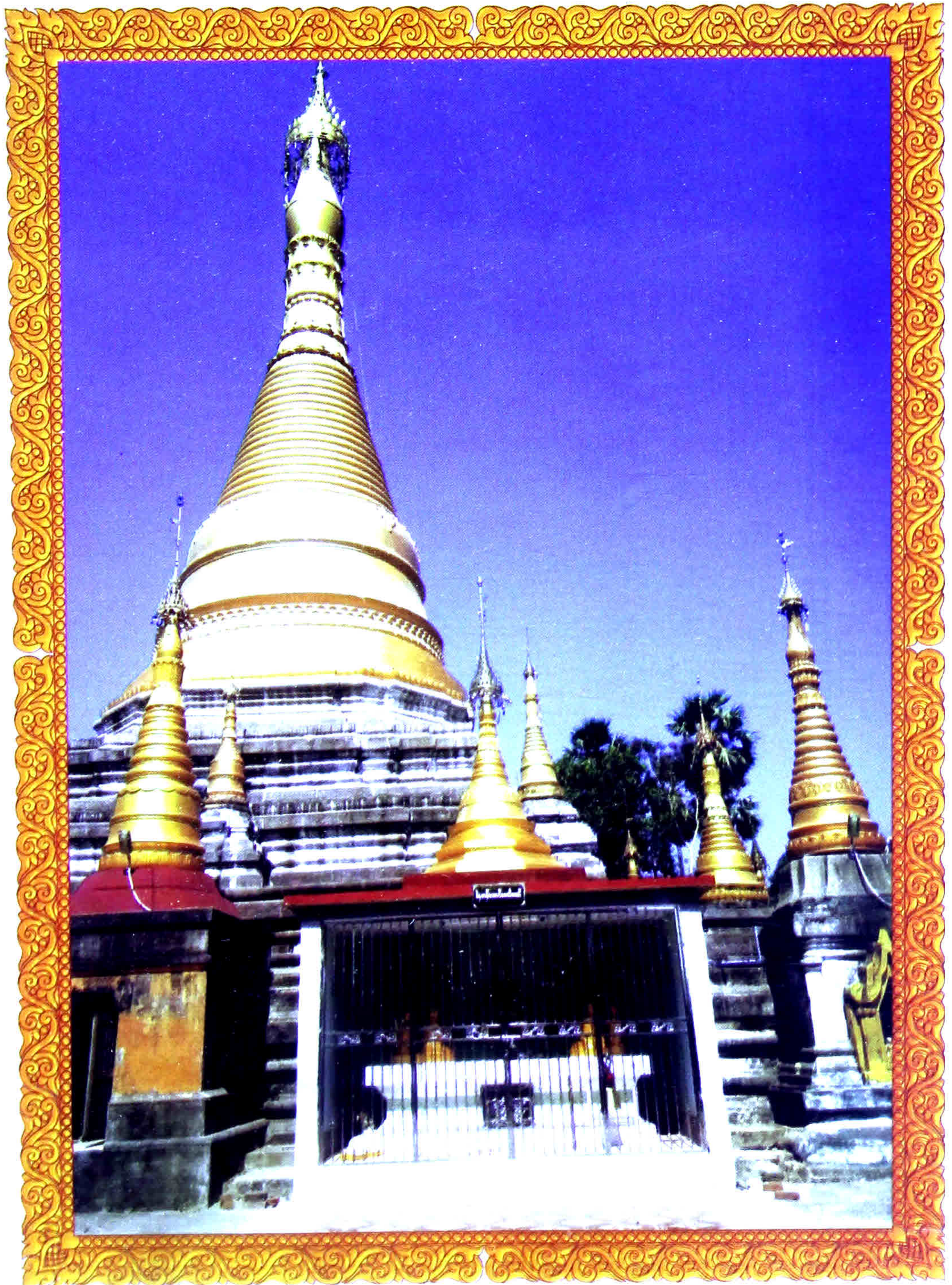
ဆားမလောက်ကျေးရွာမှ သမိုင်းဝင် အံတော်စေတီကြီး