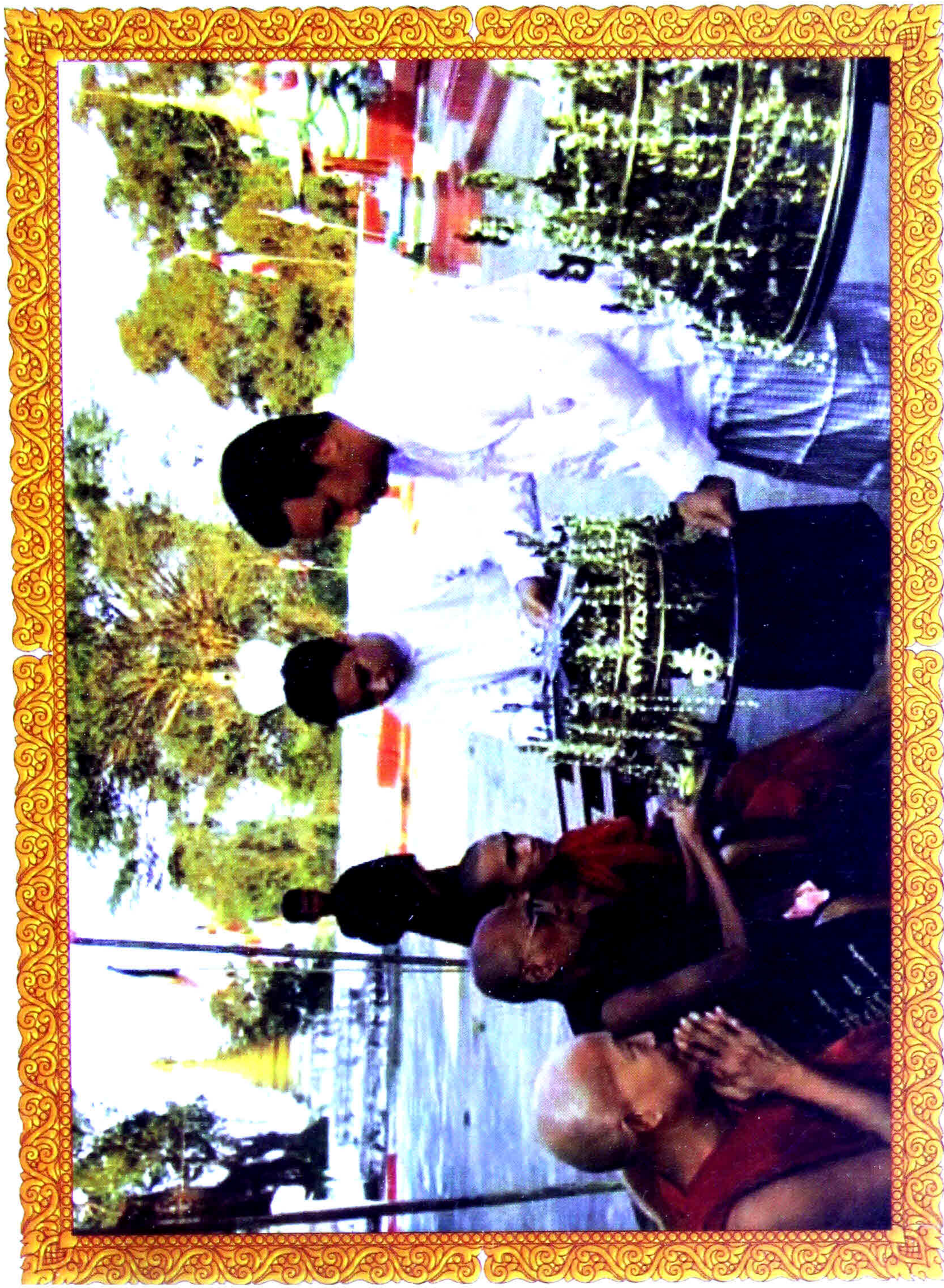
သား (၃)ဦးမှ ရွှေထီးတော်ကို သံဃာတော်သို့ ဆက်ကပ်စဉ်