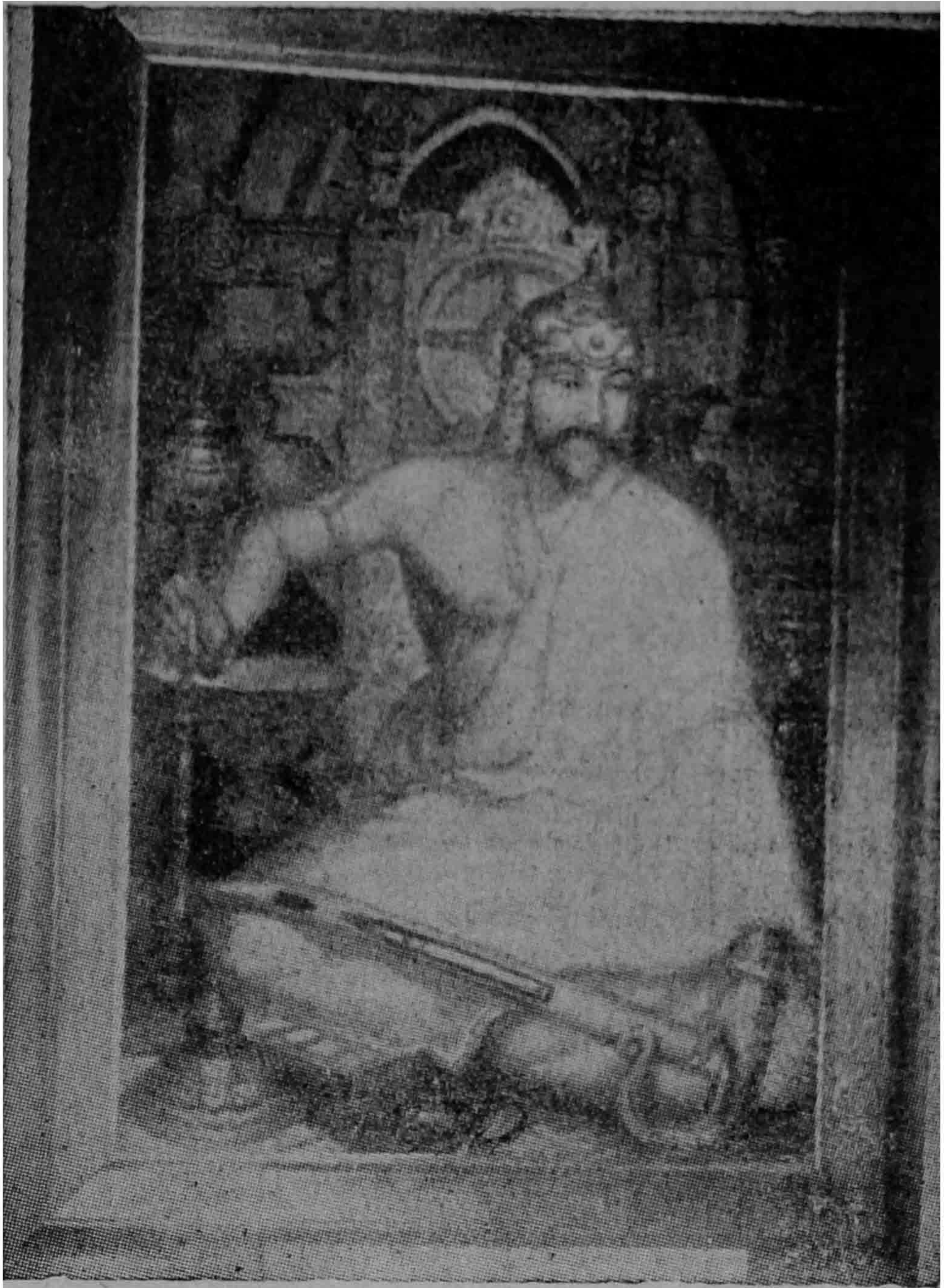
သီရိဓမ္မာဓိသကာ မင်းတရားကြီး